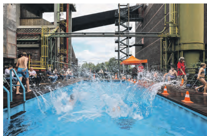
Die Kokerei bot für den Arschbomben-Contest eine spektakuläre Kulisse, und von oben blieb es sogar trocken.

Vorstandsvorsitzender der Stiftung Zollverein, betonte: „Zollverein ist ein Welterbe für alle. Der Arschbomben-Contest macht jede Menge Spaß, den Teilnehmenden, den Gästen und uns von der Stiftung auch.“ Bei den Siegerehrungen belohnte Noll alle kleinen und großen Arschbomber dann noch mit einer Überraschung und lud sie zu einer Zollverein-Rundfahrt im E-Bus ein.