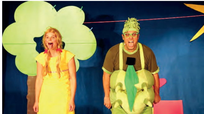
Ein Musiktheaterstück über Geschwister und andere Freundschaften.

Seitdem die kleine Polly weiß, dass sie bald ein neues Geschwisterchen bekommt, hat sie eine Baby-Allergie. Jedes Mal wenn sie „Baby“ hört, muss sie furchtbar niesen. Wozu braucht sie überhaupt einen kleinen Bruder? Ist doch alles gut so wie es ist: Mama, Papa und Polly! Sie spielt eh am Liebsten allein.