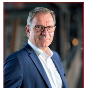
Prof. Dr. Hans-Peter Noll, Vorstandsvorsitzender der Stiftung Zollverein

gehört zu diesem Bezirk, es ist auch Ihr Welterbe, liebe Nachbarinnen und Nachbarn, Sie bringen das Leben mit. Und wir verstehen uns ganz klar als Teil dieser Nachbarschaft. Deshalb unterstützen wir das Vorhaben der Werbegemeinschaften sehr gerne, die mit dieser Zeitung dem Bezirk eine neue Stimme geben wollen. Glück auf, Nachbarschaft!