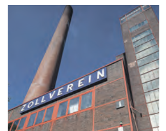
Im Rahmen von NEW NOW ziehen Künstlerinnen und Künstler in die Mischanlage.

Vom 18. September bis zum 3. Oktober ist dann die Ausstellung NEW NOW zu sehen mit raumgreifenden Installationen, virtuellen Landschaften oder performativen Skulpturen. Infos: newnow-festival.com .