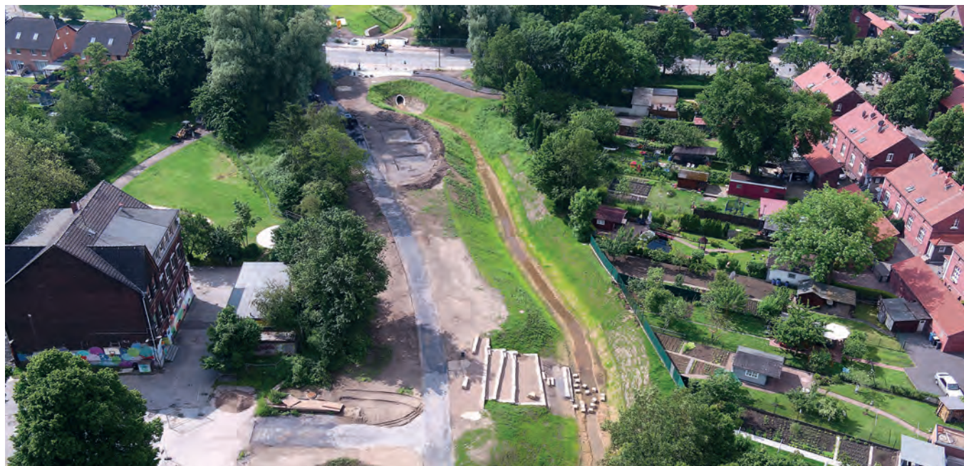
Hier entsteht ein Naherholungs- und Lerngebiet: Der Katernberger Bach lädt zum Verweilen ein. Im Vordergrund ist das stufenförmige „Blaue Klassenzimmer“ zu sehen.

Meilenstein beim Umbau des Katernberger Baches und damit ein besonderes Ereignis auch für die Menschen vor Ort war der Baustellenstart 2019. Erste Stationen wie der Spiel-