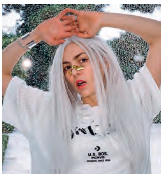
Macht den Auftakt: Rapperin Haiyti.

Am ersten September-Wochenende meldet sich das