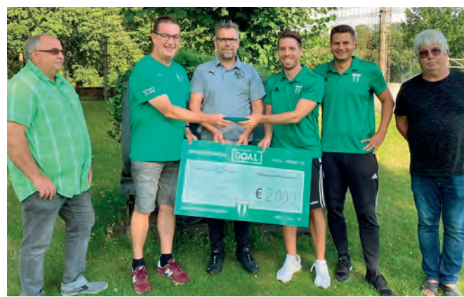
Von Stoppenberg und Haarzopf kamen noch einmal 2000 Euro dazu.