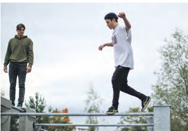
Bloß nicht nach unten schauen...

An alle Erwachsenen richtet sich das Ü40-Training (dienstags von 18-19 Uhr). Auch für Mädchen wird ein gesondertes Training angeboten: mittwochs von 17 bis 18.30 Uhr. Gruppen aus Jugendzentren und Schulklassen aus der Nachbarschaft sind auf der Parkour-Anlage immer willkommen und können bei der AWO sogar individuelle Trainingseinheiten buchen. Das Team verfügt selbst über jahrelange Parkour-Erfahrung und ist schon seit dem Bau der Anlage im Einsatz.