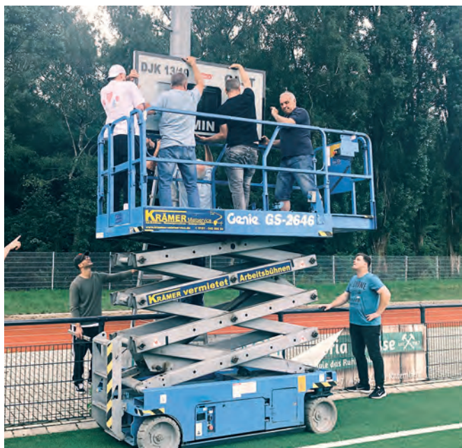
Die neue Anzeigentafel an der Meerbruchstraße hängt, dank der Scherenbühne, die dem Verein vom Krämer Mietservice kostenlos zur Verfügung gestellt wurde.

Ab dieser Saison zeigt neue Anzeigetafel das Resultat auf der Sportanlage Meerbruch