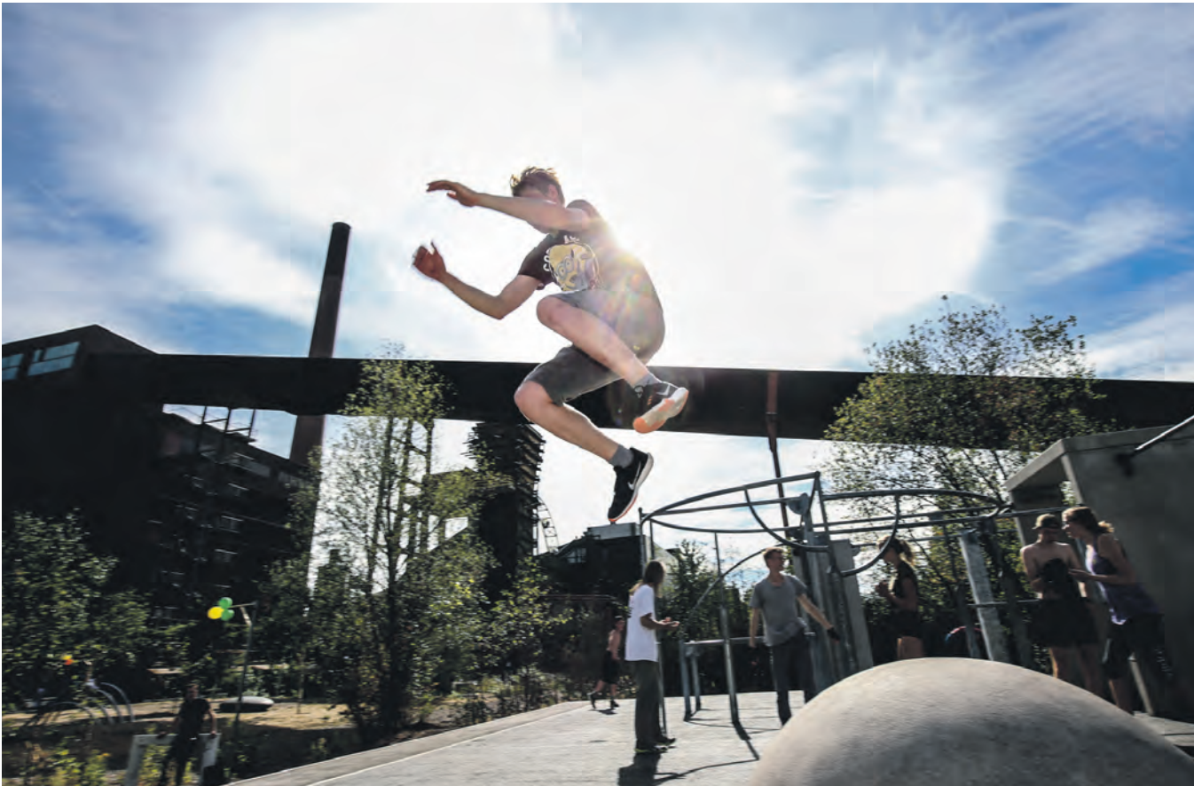
Beim Parkour ist von den Traceurinnen und Traceuren – so heißen die Aktiven in dieser Sportart – viel Körperbeherrschung gefragt.

Training auf der Parkour-Anlage für Gruppen aus der Nachbarschaft