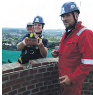
Der letzte Stein des Turms wurde Ende Juli feierlich verlegt.

pfads erst im vergangenen Jahr eröffnet. Die nächsten drei Stationen sind bereits geplant, gerade geht es an die Vorarbeiten. „Wir sorgen mit der Sanierung dafür, dass sich die Besucherinnen und Besucher