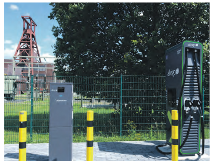
In Sichtweite des Doppelbocks können Elektrofahrzeuge auf Zollverein mit neuester Technik geladen werden.

kW, „deshalb sind wir hier schon für die Zukunft gerüstet“, erklärt Prof. Dr. Noll. Auf Zollverein werden neben dem ultraschnellen Laden für den kurzen Stopp auch Ladepunkte für Besucherinnen und Besucher mit längerem Aufenthalt angeboten. Die Bezahlung erfolgt über alle gängigen Ladekarten und Apps sowie Ad-hoc-Laden per Kreditkarte. Geladen wird mit 100 Prozent Ökostrom – damit wird der Besuch des UNESCO-Welterbes Zollverein noch nachhaltiger.