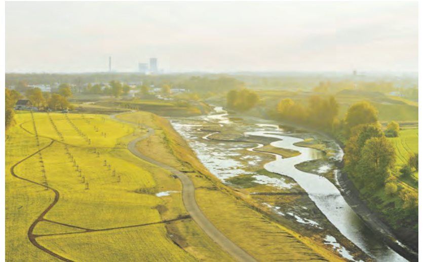
Der Suderwicher Bach mündet in die Emscher

Infos zur Ausstellung und zum Begleitprogramm auf www.ruhrmuseum.de