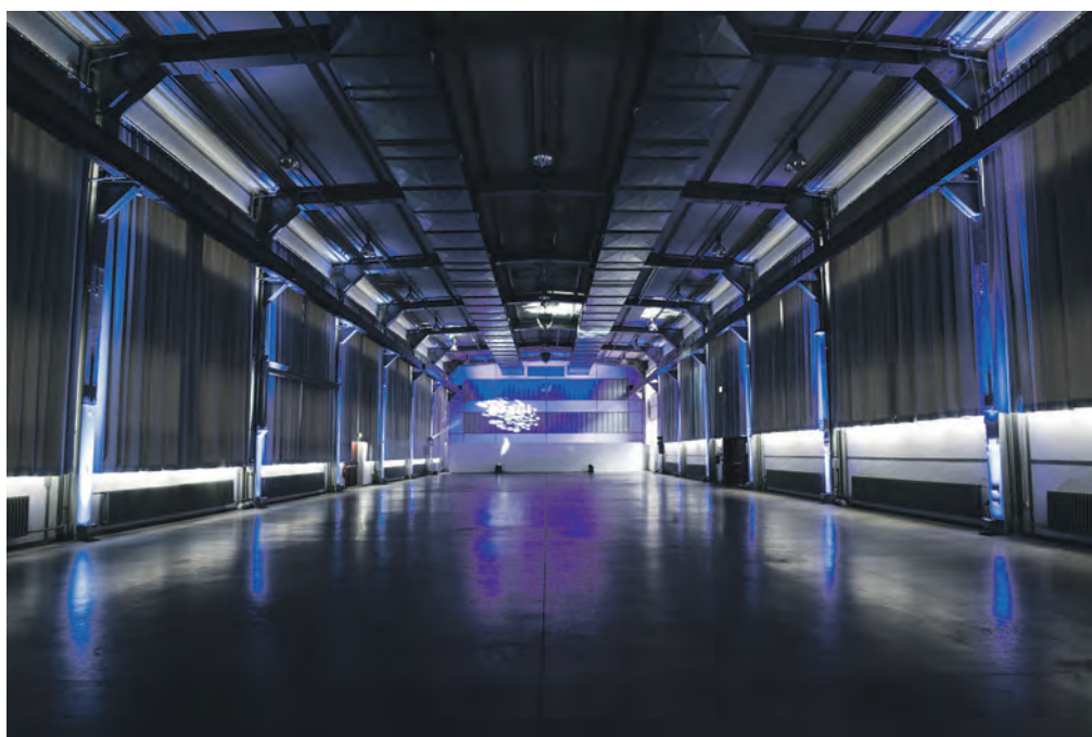
Die Zollverein-Rollschuhbahn wird in Halle 5 stattfinden. Die ehemalige Zentralwerkstatt ist 800m 2 groß.