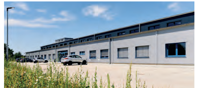
Neubau (Gebäude 13) auf dem Gelände der Triple Z AG.