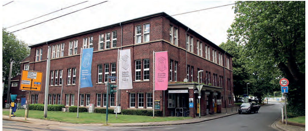
Die Einfahrt des ZukunftszentrumZollverein mit „Gebäude 1“ heute.

für Neueinzüge: 19 Startups und junge Unternehmen zogen im vergangenen Jahr ins Triple Z. Damit ist auch die Zahl der Unternehmen am Standort um 20 Prozent auf rund 100 angestiegen. „Die Nachfrage nach Büros und Produktionsflächen ist ungebrochen hoch – genauso wie die Vermietungsquote“, sagt Vorstandsvorsitzender und Zentrumsleiter Stefan Kaul. Durchschnittlich 97,6 Prozent der Büro-, Lager- und Produktionsflächen im Triple Z waren 2021 vermietet. „Damit zeigt Corona auch nach zwei Jahren Pandemie im Triple Z kaum negative Auswirkungen.“