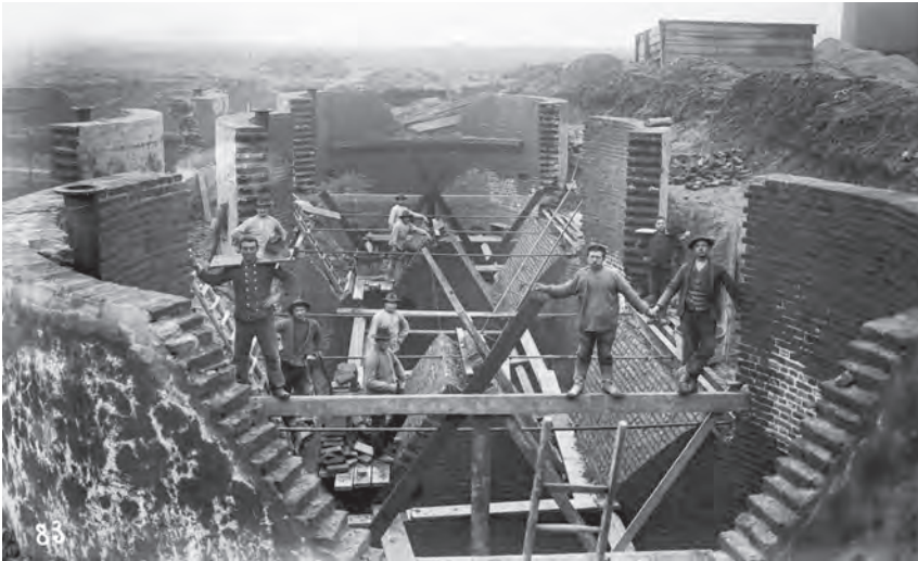
An der Kläranlage in Bochum wird ein Emscherbrunnen gebaut

Neue Sonderausstellung des Ruhr Museums wurde eröffnet