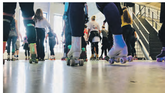
Indoor-Spaß auf Rollen