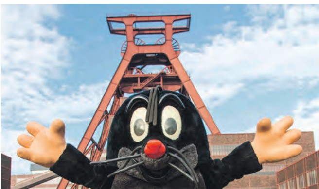
Am 3. Oktober heißt es wieder „Türen auf für die Maus!“ Mit dabei sind auch Maulwurf und Co.

Für die Angebote in der Mitmachzeche ist eine Anmeldung erforderlich. Mehr Infos unter: www.zollverein.de/maustag , www.ruhrmuseum.de/maustag