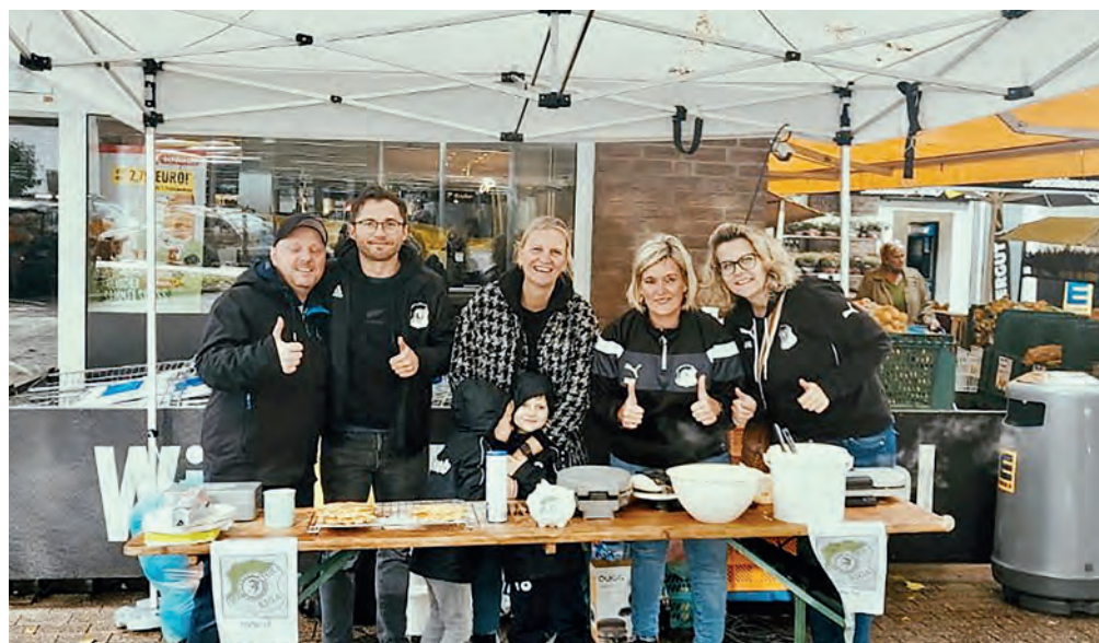
Die Eltern des Fußballkindergartens der Jungschwalben am Waffelstand vor EDEKA Abaza.