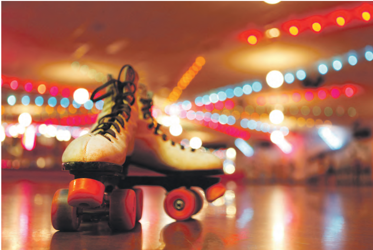
Die erste Rollschuhbahn auf einem Welterbe startet am 17.12..