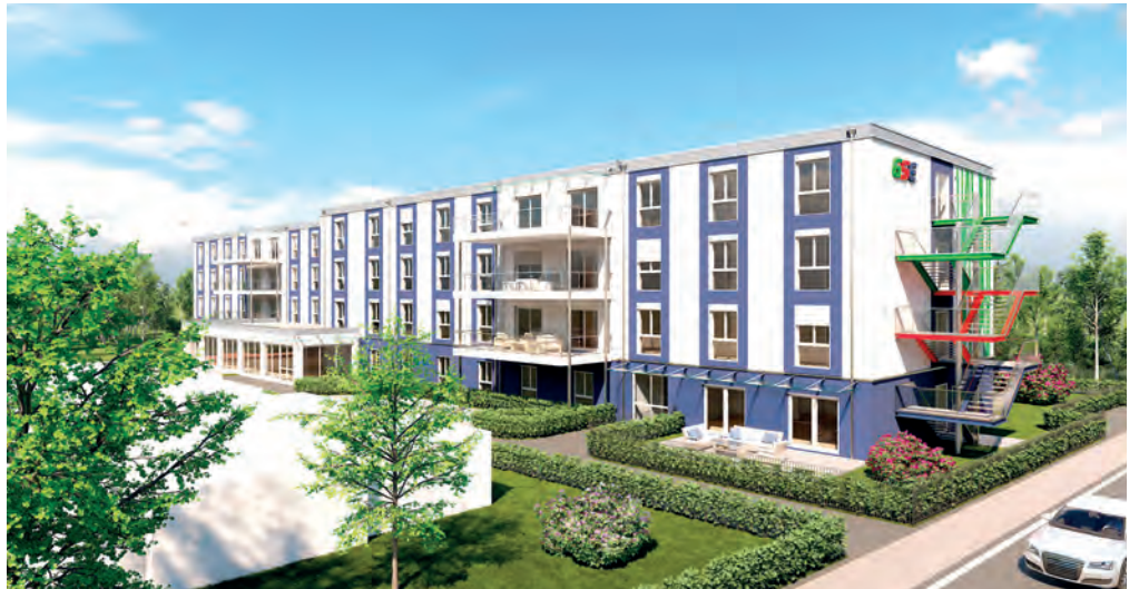
Das neue Haus der GSE in Stoppenberg. Alles ist neu, hell, freundlich und barrierefrei.

Frische Luft und die Sonne kann in einem geschützten Außenbereich genossen werden, eine große Terrasse lädt zum Verweilen ein. Wer