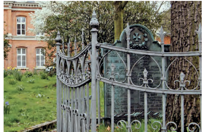
Stoppenberger Platz mit Gedenktafel.

Am 19. Juli 1870 erklärt Frankreich den Preußen den Krieg. Damit beginnt der Entschei-