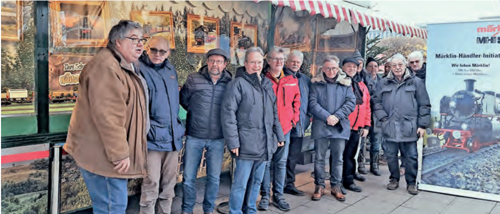
Modellbahnfans auf dem Essener Weihnachtsmarkt gründeten ihren eigenen Club.

Essener Modellbahnfans bringen Club „aufs Gleis“