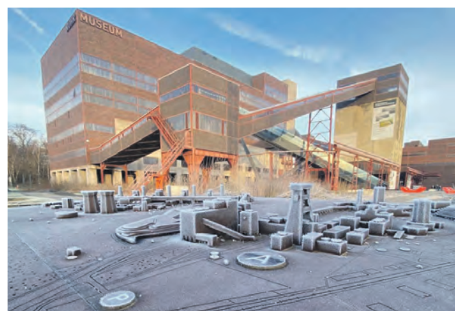
Der Audiowalk führt auch am Ruhr Museum vorbei.

Für den Klangspaziergang werden nur ein Smartphone, die Echoes-App für Audiotouren und bestenfalls Kopfhörer benötigt. Alle Informationen unter zollverein.de/audiowalk