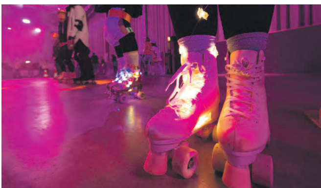
Das Novum Rollschuhbahn kam hervorragend an.

Workshops und Disco-Veranstaltungen waren ausverkauft