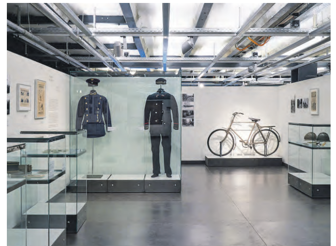
Ein erster Blick in die Ausstellung.