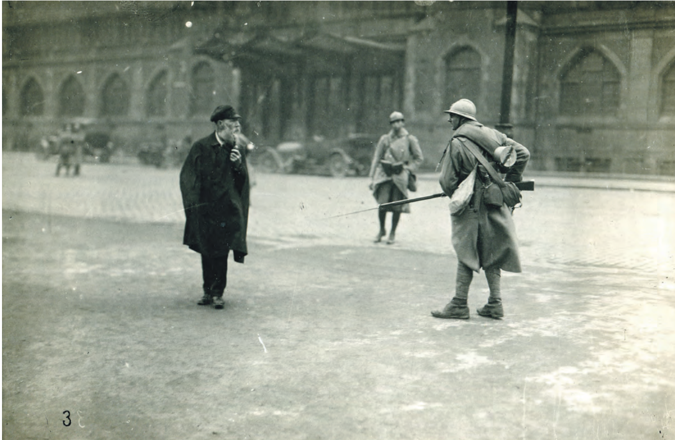
Ruhrbesetzung: Französischer Soldat mit ausgestreckter Waffe.