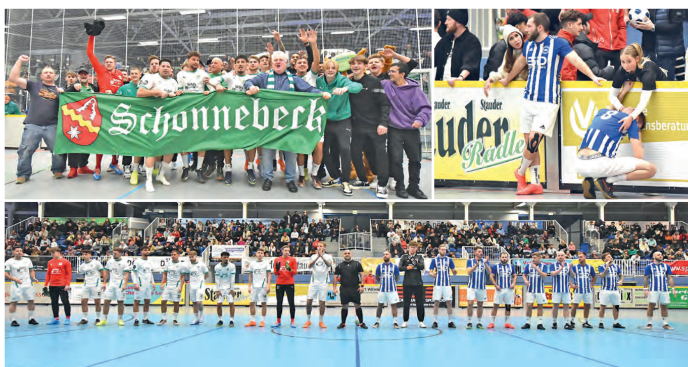
Die Gewinner kommen aus dem Essener Norden: Die SpVg Schonnebeck (l. oben) und der Zweitplatzierte Katernberg (r.o.).

3:2-Sieg nach Neunmeterschießen im Hallen-Stadtfinale gegen DJK/SF Katernberg