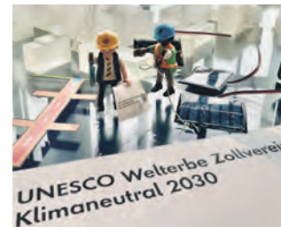
Ideen für ein Energiekonzept sind reichlich vorhanden.

Photovoltaikanlagen zu erschließen und eine grundsätzliche Überarbeitung der genutzten Gebäude, da sich der Stand der Technik seit Bau-, bzw. Umbauzeiten enorm entwickelt hat.