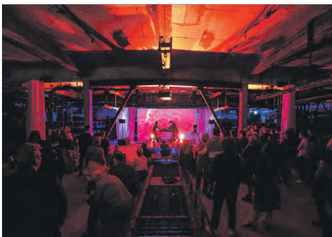
Digitale Kunst und Konzertprogramm bei NEW NOW 2021.

NEW NOW kommt zurück: Zum zweiten Mal verwandelt das Festival für Digitale Künste die Mischanlage auf