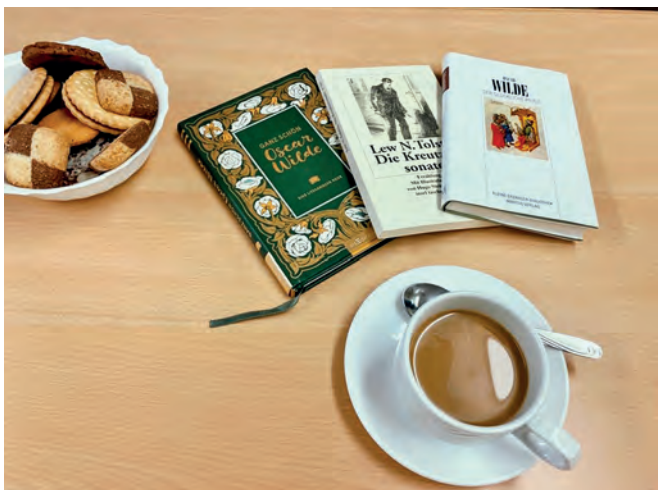
Auf dem literarischen Speiseplan stehen sowohl Klassiker als auch aktuelle Bücher.