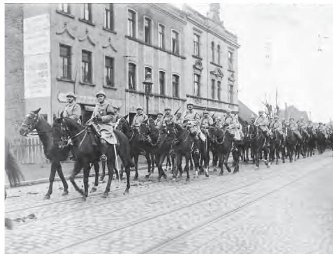
Französische Kavallerie in Buer, 1923

Tickets sind erhältlich an der Kasse des Ruhr Museums auf der 24-Meter-Ebene der Kohlenwäsche auf Zollverein oder im Online-Ticketshop. Mehr Informationen zur Ausstellung oder zu den Eintrittspreisen unter www.ruhrmuseum.de