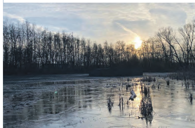
Das „Castell“ von Ulrich Rückriem bildet das Hauptwerk des sogenannten Skulpturenwalds.