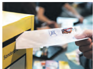
Zollverein geht postalisch auf Reisen.

Am 5. Januar 2023, dem Erscheinungstag der Briefmarke, wurde ein Stand der Deutschen Post in der Kohlenwäsche aufgebaut, also genau in dem Gebäude, das auf der Briefmarke abgebildet ist. Bei dieser kleinen Postfiliale gab es neben der Marke auch einen exklusiven