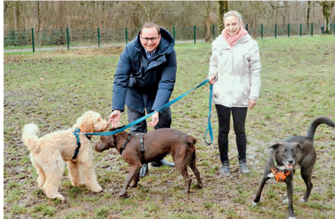
OB Thomas Kufen und die glücklichen Vierbeiner: Die Hunde können im Hallopark nun richtig durchstarten.

Oberbürgermeister Thomas Kufen war in der ersten Januarwoche im Hallopark zu Besuch. Gemeinsam mit Vertretern des Fachbereichs „Grün und Gruga“ begutachtete das Stadtoberhaupt die dort kürzlich fertiggestellte Einzäunung der Hundewiese.