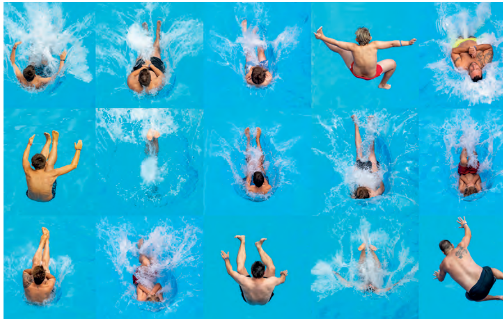
Wer schafft den perfekten Sprung vom Beckenrand? Die Antwort gibt's beim Arschbomben-Contest.