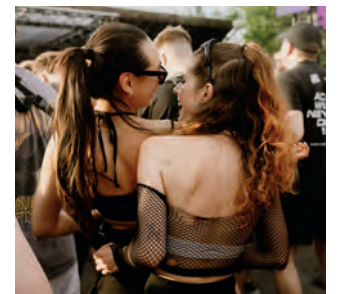
Stone Techno macht den Wandel des Ruhrgebiets hörbar, fühlbar und tanzbar.

malocht wurde, ist heute eine Kreativszene fest verwurzelt, die sich bewusst auf die Lebensleistung der Menschen im Ruhrpott beruft. Mit diesem Wandel werden Jobs und eine Erweiterung von Freizeitaktivitäten geschaffen. Das Stone Techno Projekt kommuniziert das einst größte Steinkohlenbergwerk dabei in die Welt: mindestens 40% des Festivalpublikums reiste aus dem Ausland an, zum Beispiel aus Amerika, Südafrika, Australien und Südkorea. Klingt alles großartig, muss aber natürlich nicht jedem und jeder gefallen. Kritikerinnen und Kritikern sei noch gesagt, dass auch bei einem Techno-Festival alles seine gute Ordnung hat: So endete die Musik an beiden Festival-Tagen um Punkt Mitternacht und das Orga-Team hat regelmäßig die Lautstärke gemessen und kann belegen, dass alle offiziellen Dezibel-Vorgaben und Auflagen stets eingehalten wurden.