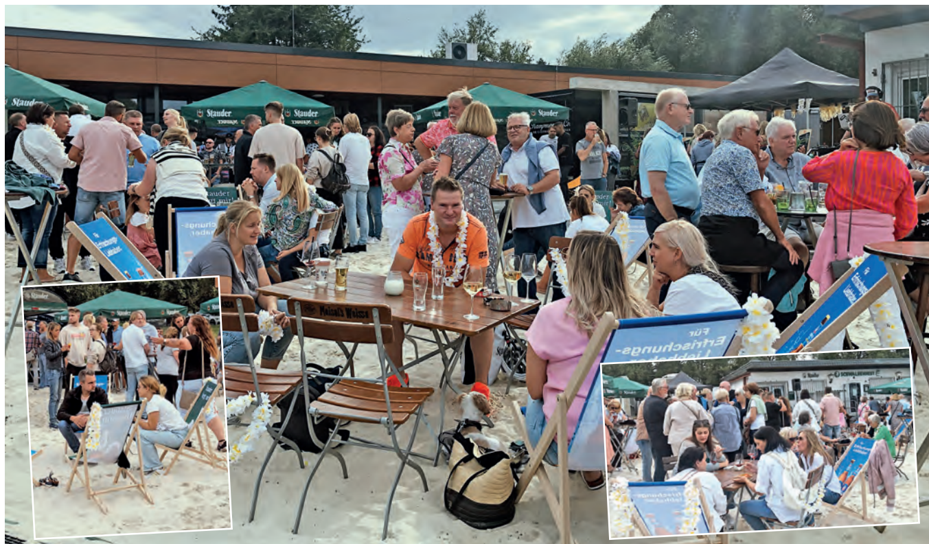
Ob im Sand, oder an langen Tischen auf dem Rasen: Am Schetters Busch herrschte bei der Premiere der Beach Party gute Laune.

Fußball-Oberligist lud zur ersten Beach-Party am Schetters Busch ein