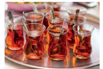
Das Quartier trifft sich auf einen Çay.

Das Erzählcafé ist ein Angebot der Stiftung Zollverein in Kooperation mit dem Ruhr Museum und der MitMach-Agentur. Die Teilnahme ist kostenlos, um Anmeldung unter besucherdienst@zollverein.de oder 0201 246810 wird gebeten.