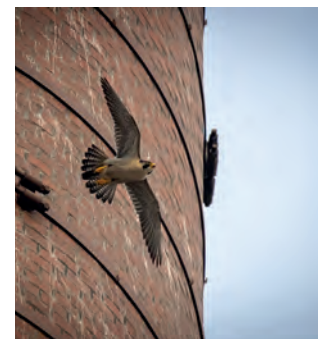
Eines der spannenden Motive der Ausstellung.

gibt einen Einblick in die vielfältige Tier- und Pflanzenwelt auf dem Welterbe. bis 27. August 2023