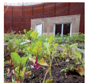
Der Modulraum bleibt auch bei heißen Temperaturen kühl - und das ohne Klimaanlage.

Variabel einsetzbar wie ein Lego-Baustein – so die Idee hinter dem „Gebäudeblock Nr. 1“, einem nachhaltigen Modulraum in Korkoptik mit großen, bodentiefen Fenstern. Der quaderförmige Prototyp hat auf der Kokerei Zollverein einen Platz gefunden. Inmitten ihres grünen Klassenzimmers für Kinder, Jugendliche und Erwachsene wird die gemeinnützige Organisation „Ackerhelden machen Schule“ den Arbeitsplatz für ihr Bildungsprogramm nutzen. Probeweise können sich künftig Unternehmen und Organisationen in den Modulraum einbuchen. Für Neugierige ist er im Rahmen von öffentlichen Veranstaltungsterminen im Ackerhelden Urban Gardening Lab geöffnet. „Im Bausektor liegt ein gewaltiger Hebel zur Erreichung der Nachhaltigkeitsziele, Mit unserer Gebäudesystemlösung zeigen wir einen konkreten Pfad auf, wie Abfallaufkommen massiv reduziert und zugleich hochgradig attraktiver Arbeitsraum geschaffen werden kann. Einen ersten Geschmack davon kann man in den kommenden Monaten anhand unseres kreislaufbasierten Prototypmoduls ‚Baustein Nr. 1‘ im wunderschönen Setting der Ackerhelden bekommen“, erklärt Bastian Michael, Geschäftsführer der Futur2K GmbH.