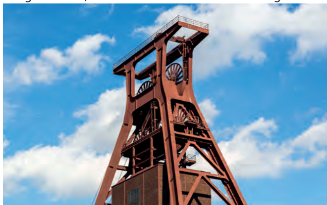
Alles in einer App: Infos über das Welterbe, Orientierung auf dem Gelände, Rundgänge zwischen Zeche und Kokerei.

Der Audiowalk „Klangtour Kunst“ fügt der Kunst auf Zollverein eine neue faszinierende Dimension hinzu. Entlang der 14 Stationen erfahren aufmerksame Zuhörerinnen und Zuhörer nicht nur detailreiche Informationen zu den Kunstwerken, sondern nehmen auch die Geräusche alter Maschinen wahr und erhalten durch die Stimmen von heutigen Mitarbeitenden spannende Einblicke. Das Klangerlebnis wurde vom Künstlerduo Nadelør speziell für Zollverein entwickelt.