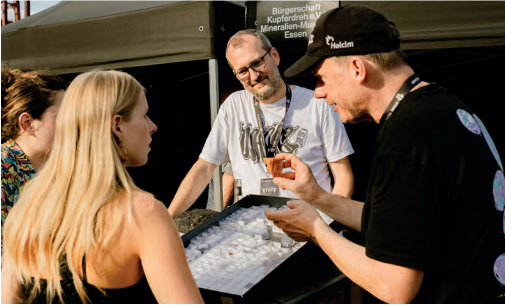
Mehr als nur Musik: Stone Techno verbindet Wissenschaft, Musik, Geschichte, Kultur und Natur.

Remmidemmi bis Mitternacht, Gäste aus allen möglichen Ecken der Welt, auffällig gekleidet noch dazu. Anfang Juli wurde das Kokerei-Areal zwei Tage lang zum Festivalgelände für die zweite Auflage des Stone Techno Festivals. Anwohnerinnen und Anwohner im Bezirk VI haben sich nicht nur über die Veranstaltung gefreut, es gab auch Kritik. Doch warum sind die Stiftung Zollverein und das Ruhr Museum Partner des Essener Künstlerkollektivs The Third Room für ein solches Event? Bei Stone Techno handelt es sich um ein noch junges Veranstaltungsformat, das auf unterhaltsame Art Wissen vermitteln möchte. Mit dem