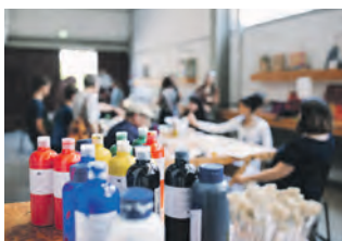
Ein Ort für Kreativität: die Kunstkaue.

Freitags wird das Welterbe zu einem Ort für künstlerisches Schaffen: Von 18:00 bis 20:00 Uhr verwandelt sich die Halle 10 in eine Kreativwerkstatt für Jugendliche. Inmitten von Leinwänden, Aquarellblöcken, Mischpaletten und Farbklecken