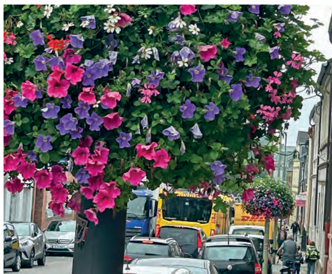
Ein Blick die Huestraße herunter zeigt, wie bunt die Blumenampeln den Stadtteil machen.

tenbau-Unternehmens, und das mit Erfolg: Die Blumenampeln wachsen, gedeihen und machen das Stadtbild bunter. - greis