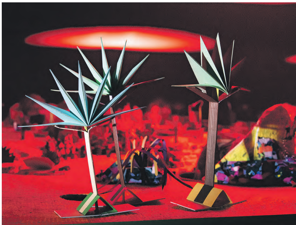
Im Rahmen der Ruhrtriennale gibt es auf dem Welterbe Tanz-, Theater- und Schauspielaufführungen in beeindruckender Industriearchitektur zu sehen.

Für die Ruhrtriennale werden Hallen, Kokereien, Maschinenhäuser und Halden des Bergbaus und der Stahlindustrie unter der Leitung der Intendantin und Regisseurin Barbara Frey zu unverwechselbaren Austragungsorten. Bis zum 23. September 2023 stehen Musiktheater, Schauspiel, Tanz, Performance, Konzerte und Bildende Kunst auf dem Programm. Das Festival gastiert auf dem Welterbe Zollverein und bietet mit der „Jungen Triennale“ Kindern und Jugendlichen die Gelegenheit, Kunst und Kultur zu erleben sowie selbst zu gestalten. Spielorte für die Tanz-, Theater- und Schauspielarbeiten sind PACT Zollverein, die Mischanlage und das Salzlager. Das vollständige Programm gibt es auf www.ruhrtriennale.de