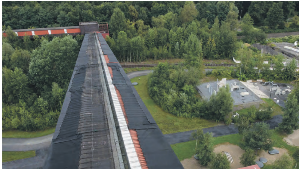
Wegen der Bauarbeiten an der nördlichen Bandbrücke muss die Ringpromenade verlegt werden und bleibt bis voraussichtlich Ende Oktober gesperrt.

werden. Die Trainingseinheiten für Parkour-Neulinge und -Fortgeschrittene finden ebenfalls weiterhin statt.