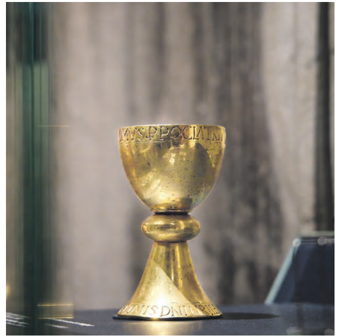
Eines der Exponate: der sogenannte Liudgerkelch. Messkelch, um das Jahr 1060.

zeugt das Steinrelief mit Frauen aus dem Jahr 1060 im sogenannten „Essen/Werdener Stil“ davon, dass Essen und Werden in dieser Zeit ein bedeutendes Kunstzentrum war. Hervorragende Handwerker und Künstler arbeiteten damals in einer sehr hohen bildhauerischen Qualität, die weit über die Grenzen der Region bekannt wurde. Eine weitere wertvolle Leihgabe erhält das Ruhr Museum aus dem Essener Domschatz: ein Reliquiar aus dem 14. Jahrhundert. Für voraussichtlich ein Jahr können die Exponate in der Dauerausstellung des Ruhr Museums besichtigt werden, danach kehren sie zu ihren Leihgebern zurück.