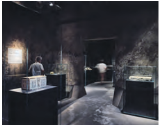
Neue Objekte in der Abteilung „Christianisierung“.

Wie die Essener Domschatzkammer stellt auch die Schatzkammer Werden dem Ruhr Museum seit 2010 im jährlichen Wechsel wertvolle Leihgaben für die Dauerausstellung des Ruhr