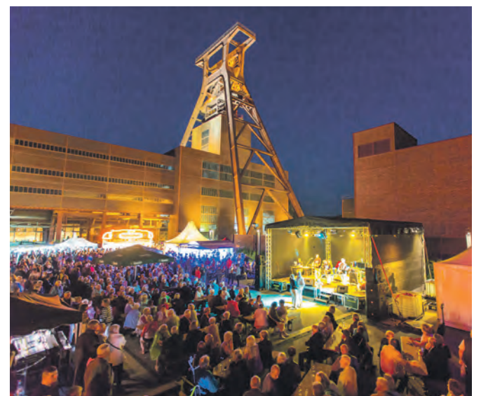
Feiern unter dem Doppelbock: beim Zechenfest.

chenende sind zudem der Besuch von Ausstellungen oder die Teilnahme an Führungen kostenfrei. Am Freitag fällt mit der offiziellen Eröffnung der Startschuss für das Zechenfest und verschiedene Musik-Acts sorgen bis 22 Uhr für Tanzstimmung. An dem nachfolgenden Wochenende werden Gäste gemeinsam mit dem Ruhrkohlechor und dem Ruhrkohleorchester beim Singen des Steigerliedes zu einem großen Knappenchor und können sich am Sonntag auf den beliebten Familientag freuen.