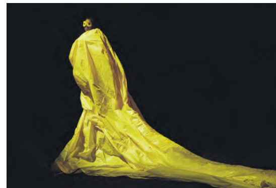
In „The Living Monument“ verschwimmen die Grenzen zwischen Vergangenheit, Gegenwart und Zukunft. Körper, Stoffe und Objekte verändern sich fortlaufend, finden neu zusammen und erschaffen eine Welt mit intensiven Farben, in der die Zeit stillzustehen scheint.