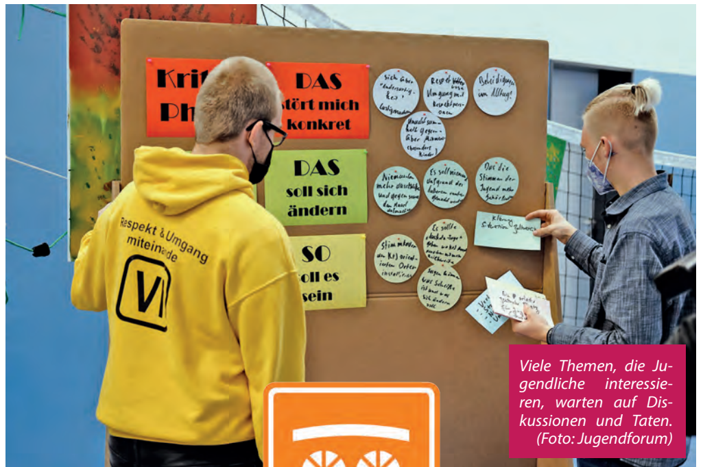
Viele Themen, die Jugendliche interessieren, warten auf Diskussionen und Taten.