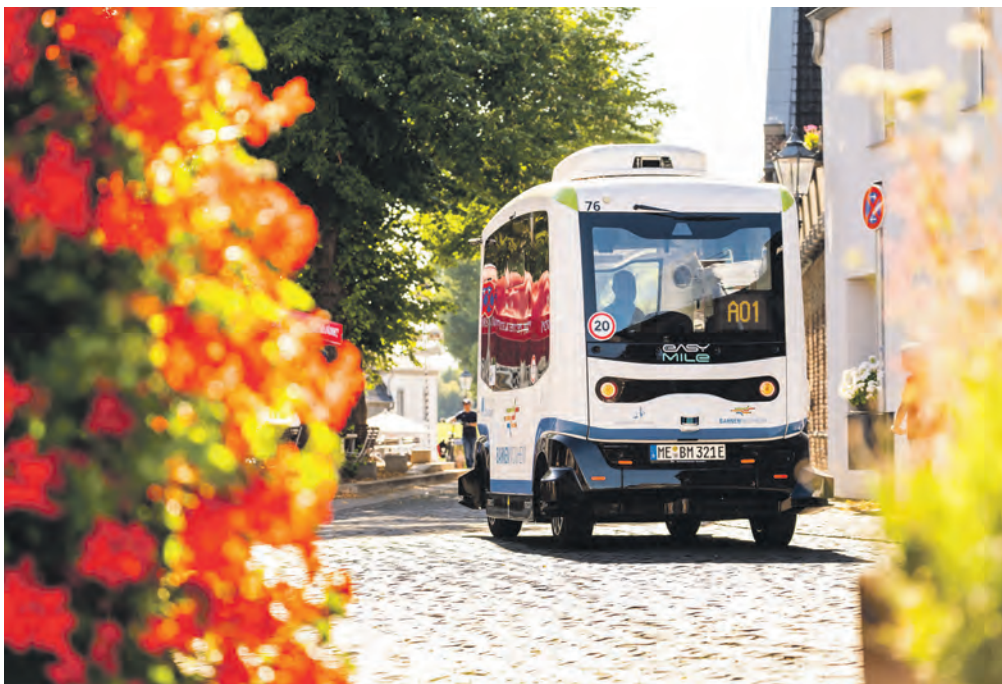
Autonom unterwegs: die Busse der Bahnen.Monheim.