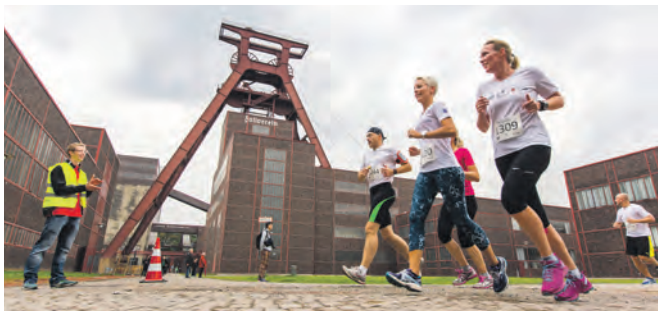
Laufvergnügen inmitten von Industriearchitektur.

Die Wege auf Zollverein werden zur offiziellen Laufstrecke. Ob 400-Meter-Bambini-Lauf oder der zehn Kilometer lange Hauptlauf: Sportfans suchen sich einfach die pas-