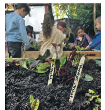
Hier wächst bald Roter Salat.

sen und Kindergartengruppen aus den umliegenden Stadtteilen bauen die Ackerhelden frisches Bio-Gemüse auf dem Welterbe an und zeigen, warum eine bunte Vielfalt im Beet so wichtig ist, wie gesunde Lebensmittel entstehen und welche Rolle Insekten dabei spielen. Die Stiftung Zollverein unterstützt dieses Projekt gerne und freut sich, dass ihre Nachbarn voneinander profitieren und die Kinder bereits am ersten Tag viel Spaß mit ihren eigenen Gemüsebeeten hatten.