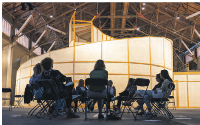
Welche Projekte und Ideen bringen die Teilnehmenden mit in den Workshop?

Stiftung Zollverein lädt Jugendliche zum Workshop ein