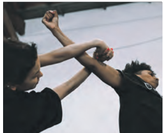
Szene aus „Cracks“ von Choreograf Rauf Yasit.

Vier Tage lang können Interessierte an Workshops teilnehmen, zu DJ-Sets abtanzen, Lesungen lauschen oder urbanes Tanztheater bestaunen. Austragungsorte sind der öffentliche