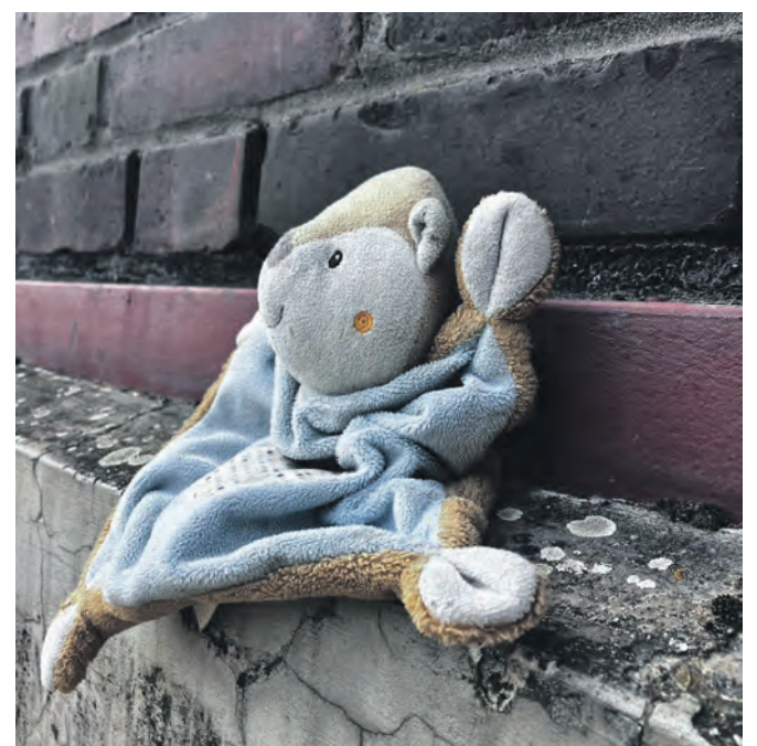
Happy End für das Teddy-Schmusetuch „Filou“.

heißt wir! Auf eine ebenso glückliche Zusammenführung wartet derweil ein anderer Gegenstand, nämlich ein Kamera-Stativ, das die Stiftung einige Tage nach dem Zechenfest postalisch erreichte. Dabei ein Brief, so ehrlich wie das Ruhrgebiet. Im betrunkenen Kopf wählte der Schreiber es eine gute Idee, das Stativ mitzunehmen, später meldete sich das Gewissen. Ohne Absender, aber mit einer sehr aufrichtigen Entschuldigung bat man höflich, es dem rechtmäßigen Besitzer zurückzugeben. Ein Facebook-Aufruf blieb bislang erfolglos, aber vielleicht kommt das Happy End ja auch hier wie bei Filou.