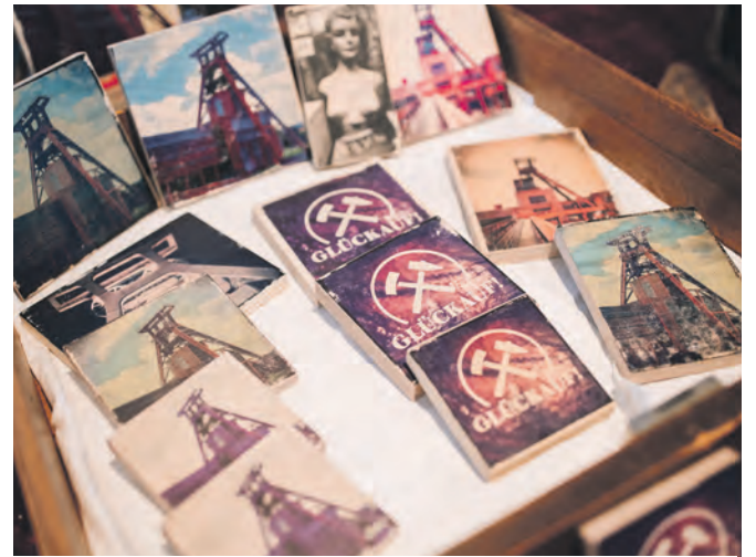
Ruhrgebiets-Romantik für Zuhause beim Designmarkt „Handverlesen“.

Wer schon auf der Suche nach einem Weihnachtsgeschenk ist, wird hier sicher fündig: Zwischen kleinen Portmonees und großen Taschen sowie Postkarten mit