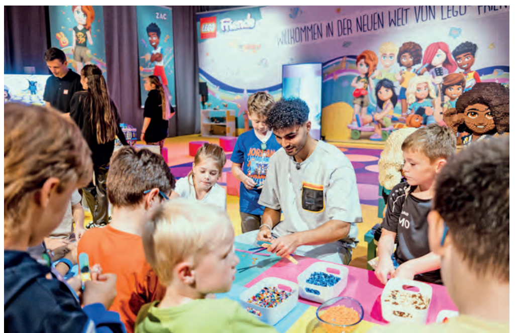
Groß und Klein hatten gemeinsam viel Spaß.