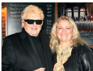
Heino und Anita.

Übungen für die Stimmbänder und ganz viel Schlaf - das ist das tägliche Fitness-Geheimnis des 84-jährigen Heino, der in den nächsten Wochen auf eine Kirchentournee mit 23 Terminen in drei Monaten in Deutschland, Österreich, Italien und Belgien geht, zusammen mit Anita Hegerland. Darunter auch bei einem Auftritt am 18. November im Katernberger Bergmannsdom.