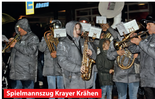
Spielmannszug Kraye Krähen