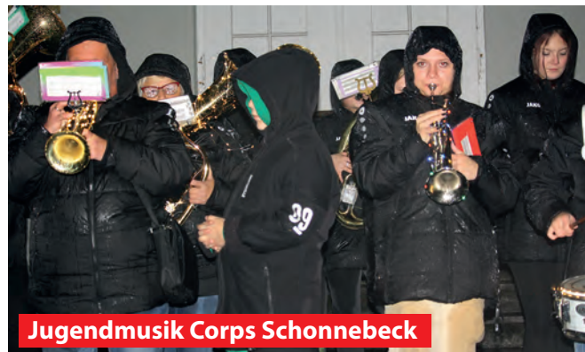
Jugendmusik Corps Schonbeck