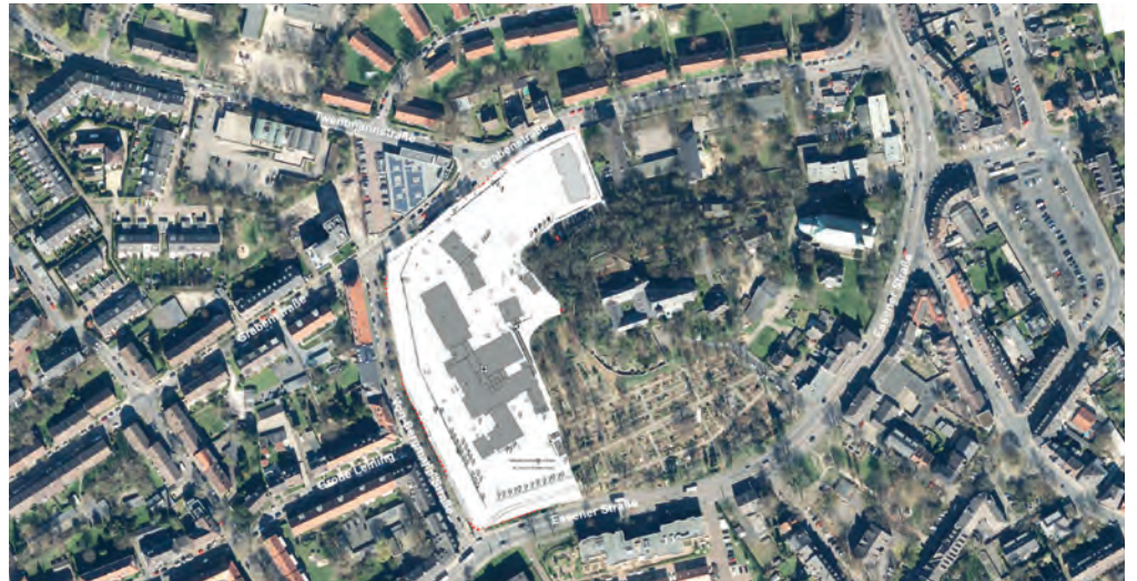
Die Planungen stehen, jetzt rückt die Umsetzung in den Mittelpunkt: Ein Luftbild, das im Rahmen einer Machbarkeitsstudie entstand.