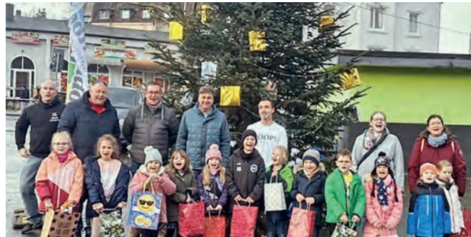
Dieser Baum ist toll geworden: Der Vorstand der Werbegemeinschaft Stoppenberg und ein Teil der 81 beteiligten Grundschul-Kinder freuen sich über das gelungene Werk.

für erhielten die Kinder auch als Dankeschön eine Tasche, unter anderem mit einem von REWE Sliwik beigesteuerten Nikolaus und einer Brotdose, oder auch einem Kuschtier von der Sparkasse Essen. Die Freiwillige Feuerwehr Stoppenberg übernahm die wachsame Aufsicht und sorgte beim Nachwuchs mit ihrem Gerät und den Fahrzeugen auch für leuchtende Augen. Auch Vertreter der Werbegemeinschaft Stoppenberg, die den kleinen, aber feinen Markt organisierte, waren natürlich vor Ort und hatten interessante Stände und Informationen mitgebracht, wie der PN Pflegedienst, die Diakonie, handarbeitliche Angebote und Schmuck. Für das leibliche Wohl sorgte der Nikolaus-Grill, auch für flüssige Verpflegung und musikalische Unterhaltung war gesorgt. - greis