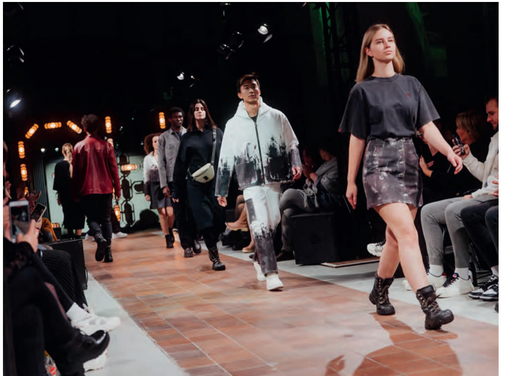
Die Models der Grubenhelden verwandelten die Halle 8 auf Zollverein zum Catwalk und präsentierten den 300 geladenen Gästen die neue Kollektion.