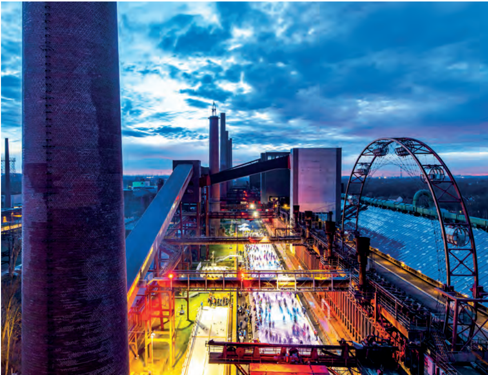
Seit 23 Jahren können sich Eislaufaffans auf der Zollverein-Eisbahn austoben. Am Abend sorgt eine Lichtinstallation für eine besondere Atmosphäre.

Schlittschuhe gleiten leise über das Eis, bunte Lichter spiegeln sich auf der glatten Oberfläche und nebenan schießt ein Eisstock seinem Ziel entgegen: Auf dem UNESCO-Welterbe Zollverein beginnt die Eisbahnsaison! Rund vier Wochen, von Samstag, 9. Dezember 2023, bis Sonntag, 7. Januar 2024, verwandelt sich das Druckmaschinengleis auf der Kokerei in eine 150 Meter lange Eisfläche. Zur offiziellen Eröffnung am 9. Dezember um 11:30 Uhr kommen die Nachwuchstalente des Essener Jugend-Eiskunstlauf Vereins e.V. und zeigen ihr Können.