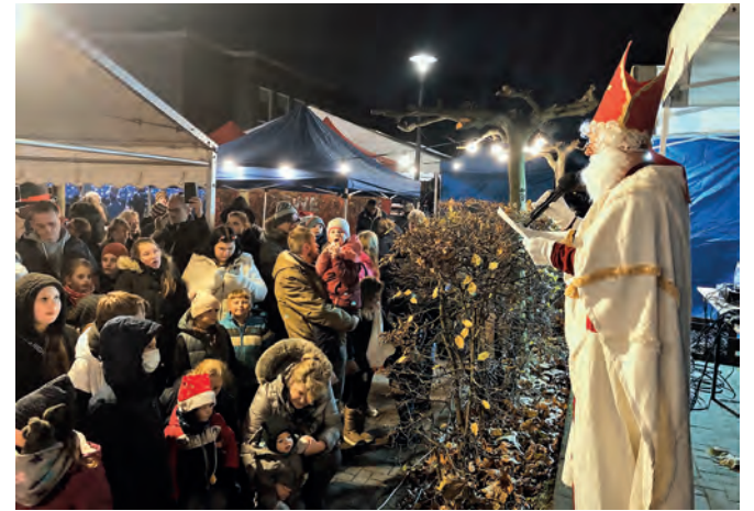
Ab 17.30 Uhr schaut auch der Nikolaus vorbei.

Natürlich stehen auch Klö- nen, Essen und Trinken auf der Agenda, Gemütlich- keit wird groß geschrieben. Und wenn so gegen 17.30 Uhr dann der Nikolaus vor- bei schaut und auch bleibt,