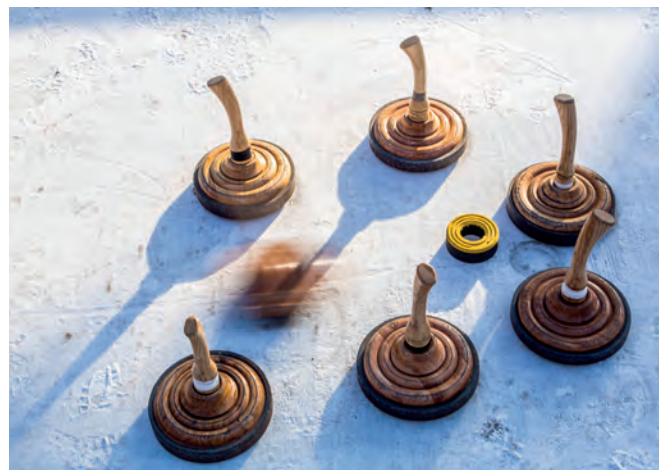
Wer seinen Eisstock am nächsten an der sogenannten Daube platziert, holt den Sieg beim Eisstockschießen.

Wer sich gerne aufs Eis, aber nicht auf Schlittschuhe begeben will, kann sich im Eisstockschießen probieren: In direkter Nähe zur Eisbahn steht eine eigene Fläche für den beliebten Wintersport zur Verfügung. Präzision und ein geschicktes Händchen zahlen sich beim Eisstockschießen aus. Ziel des Spiels ist es, den Eisstock am