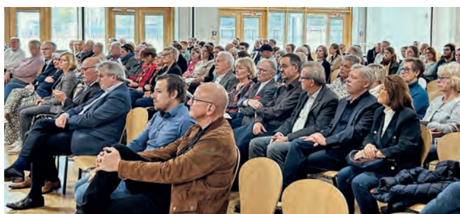
Die Katernberg-Konferenz war wieder gut besucht.

es von den Beteiligten unter anderem einen Rückblick über die der vergangenen 30 Jahre der Katernberg-Konferenz, sowie Reden und Diskussionsbeiträge zu aktuellen Herausforderungen in den Stadtteilen.