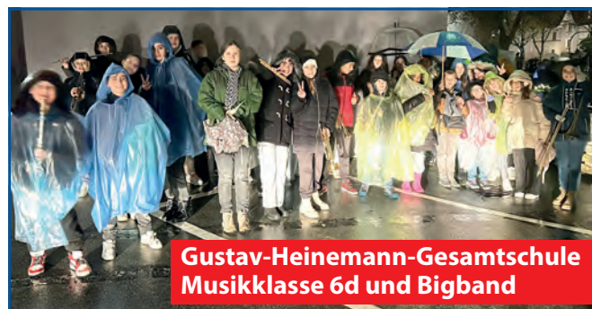
Gustav-Heinemann-Gesamtschule Musikklasse 6d und Bigband