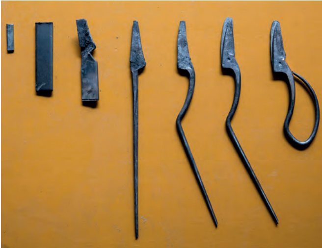
Modelle des Herstellungsprozesses der Bonsai-Schere von Taira Kibasami Works, Sanjo, Japan.

Von iPod und Bonsai-Werkzeug: Red Dot Design Museum zeigt KOUBA-Prinzip