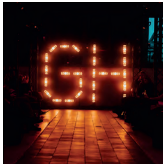
Kurz vor Beginn der Fashion Show: Die Spannung steigt.

ist von der gemeinsamen Kollektion begeistert: „Zollverein ist gigantisch. Darum sind wir mit dem nötigen Respekt an die Designs der neuen Kleidungsstücke herangegangen. Auf das Ergebnis sind wir stolz und blicken bereits auf weitere Editionen – schließlich