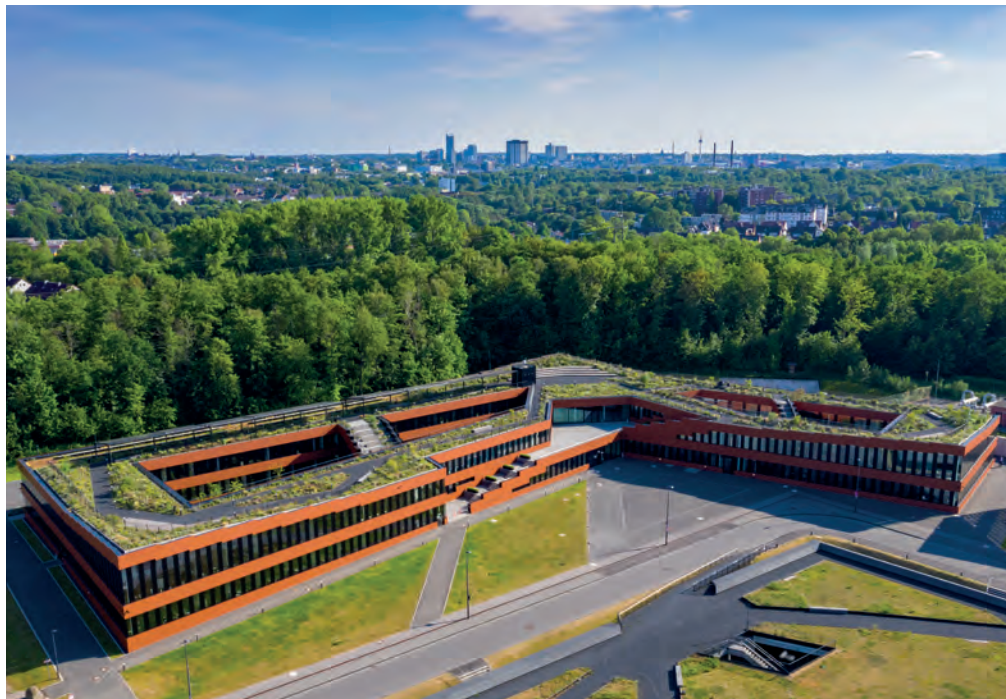
In diesem Gebäude haben die RAG-Stiftung und die RAG AG seit dem Jahr 2017 ihren Sitz. Es steht auf dem Areal der Kokerei Zollverein.

Die Vorbereitungen für den Neubau auf dem Kokereigelände seien bereits weit fortgeschritten. Für die Bauvoranfrage liegt laut RAG-Stiftung ein positiver Bescheid vor. Der entsprechende Antrag soll Ende März 2024 eingereicht werden, um dann so früh wie möglich bauen zu können. Das Aachener Architekturbüro kadawittfeldarchitektur hat das Gebäude entworfen. Wenn der aktuelle Zeitplan eingehalten werden kann, sei Ende 2026 ein Einzug möglich.