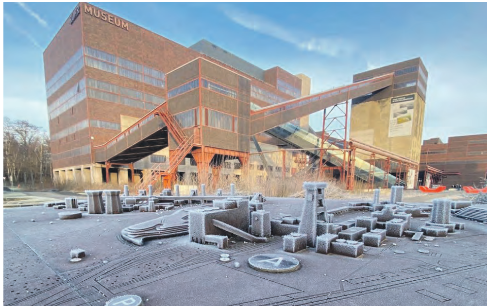
Winterstimmung auf dem Welterbe: An den Feiertagen wird es um den Doppelbock etwas ruhiger, für Spaziergänge ist das weite Gelände immer frei zugänglich.

Über die Festtage ist das weite Gelände des UNESCO-Welterbes Zollverein wie immer frei zugänglich und eignet sich für einen Spaziergang – zum Beispiel entlang der Ringpromenade und über die Halde. Inspiration für einen Kunstspaziergang, der die verschiedenen Kunstwerke auf dem Areal verbindet und erläutert, gibt es in der Zollverein-App. An Heiligabend (Sonntag, 24. Dezember), am 1. Weihnachtsfeiertag (Montag, 25. Dezember) und an Silvester (Sonntag, 31. Dezember) bleiben die Zollverein-Eisbahn , das Ruhr Museum , das Portal der Industriekultur und das Besucherzentrum Ruhr geschlossen . Auch die Guides, die sonst Hunderte Besucherinnen und Besucher pro Tag über das Welterbe führen, haben an