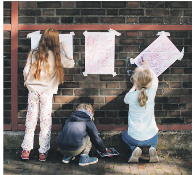
Zollverein künstlerisch entdecken: zum Beispiel bei einem Kindergeburtstag.

Egal ob Tiersafari, Eiszeit oder Fossilien fälschen: Ein Kindergeburtstag im Ruhr