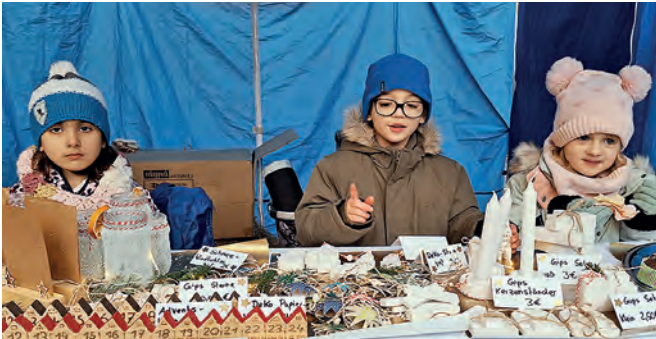
Kerzenständer und Adventskalender boten die Kinder des Städtischen Familienzentrums Imbuschweg unter dem Bergmannsdom an.

Die liebevoll gestalteten Stände waren gut besucht