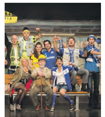
Fußball ist Herzenssache: auch bei Ronaldo und Julia.