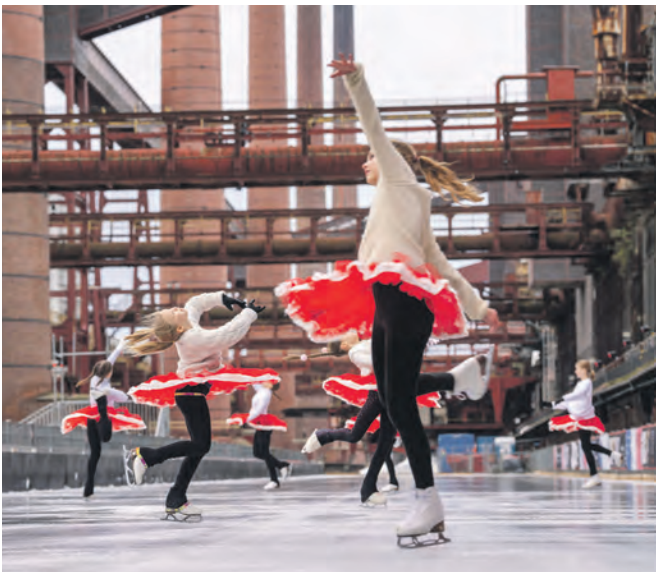
Haben das Publikum mit ihrer Performance auf dem Eis begeistert: die Sportlerinnen des EJE e.V.

der jeweils ersten Stunde der Öffnungszeiten inklusive Laufzeiten an, die einen geschützten Rahmen für Menschen mit Behinderungen eröffnen. Gemeinsam mit ihren Familien, Freundinnen und Freunden sowie anderen Schlittschuhfans können sie sich mit Rollstühlen, Reha-Buggys und Gleithilfen auf die Eisbahn begeben. Auch außerhalb der inklusiven Laufzeit steht einem Eisbahnbesuch selbstverständlich nichts im Wege. Wer lieber ohne Schlittschuhe aufs Eis geht, kann sich im Eisstockschießen ausprobieren: In direkter Nähe zur Eisbahn steht eine eigene Fläche für den beliebten Wintersport zur Verfügung. Ziel des Spiels ist es, den Eisstock am nächsten an die sogenannte „Daube“, eine Art großen Puck, heranzubringen. Auf insgesamt acht Bahnen können Familien, Freunde oder Kolleginnen und Kollegen in den Wettkampf im Eisstockschießen treten und ihr Können unter Beweis stellen. Die Eisbahn ist bis Sonntag, 7. Januar 2024, geöffnet. Informationen unter zollverein.de/eisbahn .