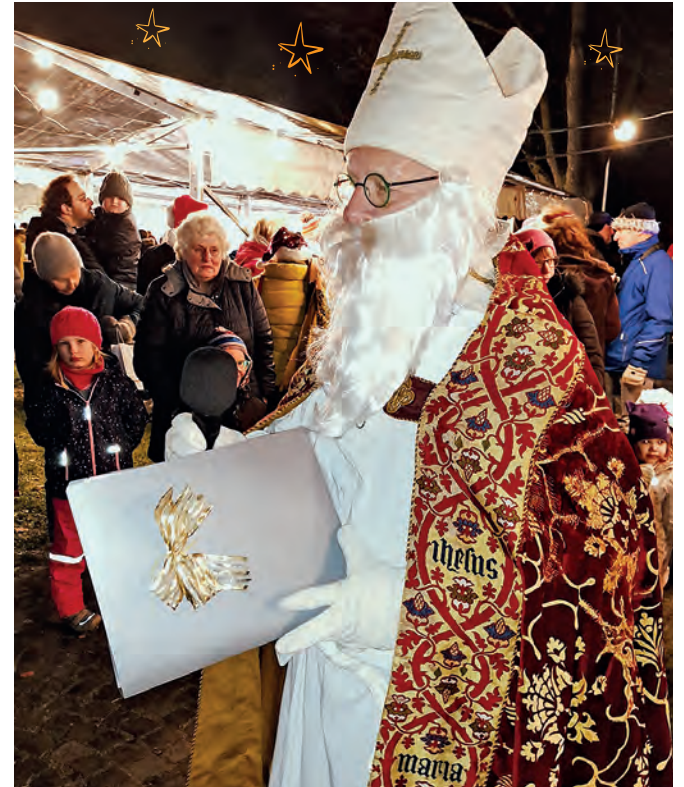
Glückliche Augen schauten auf die Stutenkerle, die der Nikolaus für die Kinder mitgebracht hatte. Aber es gab nicht nur Geschenke. Aufmerksam hörten die Kinder und Erwachsenen der Lebensgeschichte des heiligen Nikolaus zu.