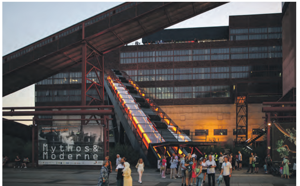
Die orange Rolltreppe, die in die Kohlenwäsche führt, ist ein beliebtes Fotomotiv und fügt sich harmonisch in das Gesamtbild des Geländes ein.