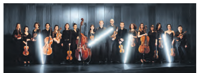
Für einen Abend trifft DiscoPop auf Streicherklang.

Folkwang Kammerorchester präsentiert ABBA-Hits