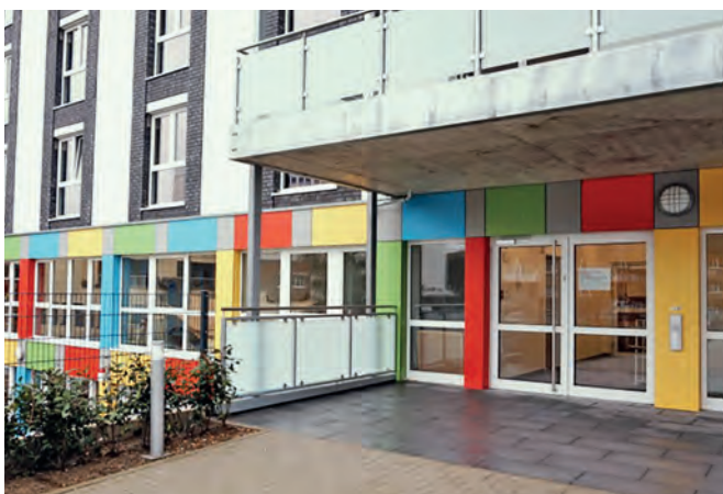
Der neue Eingangsbereich der Kita Essener Straße wurde für die Kinder bunt gestaltet.