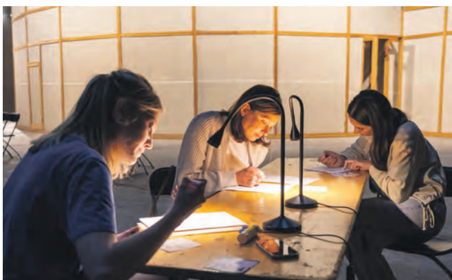
Teilnehmende lassen ihren Gedanken freien Lauf.

sen. Besondere Vorkenntnisse sind nicht erforderlich, die Teilnahme ist kostenfrei. Interessierte werden gebeten, sich bis zum 23. Februar 2024 per E-Mail unter besucherdienst@zollverein.de anzumelden. Eine Neuerung im Jahr 2024: Im Zuge einer neuen Kooperation von Stiftung Zollverein und Junior Uni Essen sind die ersten zehn Plätze exklusiv für Studierende der Junior Uni reserviert. In diesem Rahmen sollen deren Teilnehmende nicht nur das neue Kulturprogramm auf Zollverein kennenlernen, sondern vor allem gemeinsam kreativ werden und gesellschaftlich relevante Themen für unsere Zukunft diskutieren. Die Studierenden der Junior Uni können sich ab dem 4. Februar 2024 unter www.junioruni-essen.de anmelden.