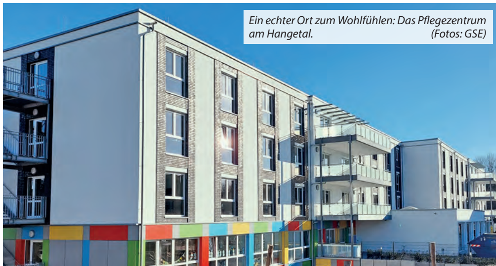
Ein echter Ort zum Wohlfühlen: Das Pflegezentrum am Hangetal.

Eine offizielle Eröffnung ist noch in Planung – gern würden wir mit allen Einrichtungen gemeinsam feiern“, so GSE-Geschäftsführer Stefan Diederichs. Bereits in Kürze ist ein Tag der offenen Tür in der neuen Tagespflege geplant, bei der das Angebot vorgestellt und die Räumlichkeiten besichtigt werden können. „Mit 14 Plätzen sind wir eine kleine, familiäre Ein-