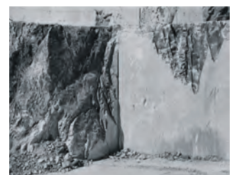
Eines der ausgestellten Fotos im SANAA-Gebäude: Fraktur, Italien, 2021 | Foto: Laura Pecoroni

tag, 26. Januar, bis Sonntag, 11. Februar 2024, ausgestellt. Am Donnerstag, 1. Februar 2024, organisieren die Studierenden des Studiengangs „Photography Studies and Research“ von 10 bis 16 Uhr einen Workshop auf Englisch. Darin sprechen die Teilnehmenden über Fotobücher. Der Eintritt zur Ausstellung und die Teilnahme am Workshop sind kostenfrei. Infos unter zollverein.de/stopover