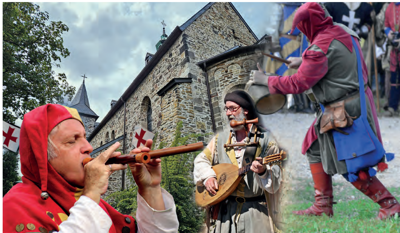
950 Jahre Stiftskirche – auch vor dem Stoppenberger Rathaus wird gefeiert.

Stoppenberg feiert 950 Jahre Stiftskirche – mit Ausstellung und Pontifikalamt