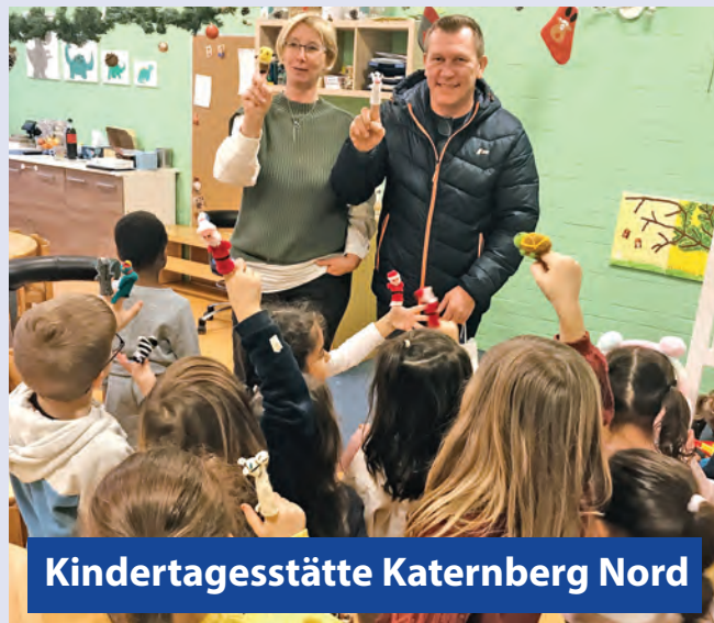
Kindertagesstätte Katernberg Nord

der Kinder in den Kindertagesstätten Imbuschweg 1a, Schniedtkamp und Distelbeckhof verteilt. - greis