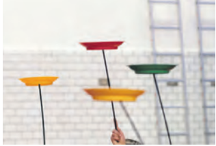
PACT veranstaltet schwungvolle Kids Days.

Die Bühne von PACT Zollverein wird zu einem sich drehenden Universum. Die belgische Kompagnie „tout petit“ („winzig“) verzaubert das Publikum mit einer Mischung aus Tanz, Musik und schwingenden oder kreiselnden Gegenständen.