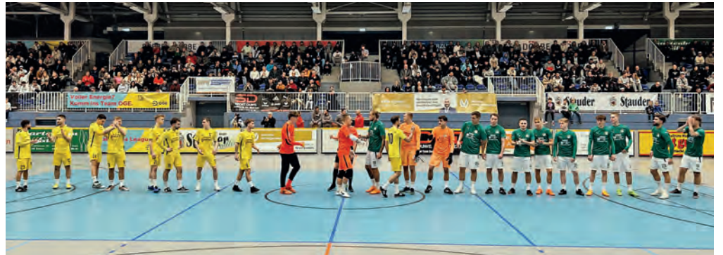
Im Finale der 28. Essener Hallenstadtmeisterschaft unterliegt der Oberligist SpVg. Schonnebeck gegen den Landesligisten Sportfreunde Niederwenigern mit 1:4. (Foto: Frank Zimmers)

Niederwenigern für den Titelverteidiger aus Schonnebeck beim 1:4 an diesem Nachmittag in der Sporthalle am Hallo als zu stark. Die beiden weiteren Vertreter aus dem Bezirk VI, der FC Stoppenberg und die Spfr. Katernberg, schieden in diesem Jahr bereits vor dem Final-Wochenende aus.