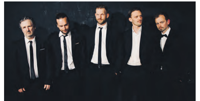
Wer hat seine Kollegen nach dem Überfall auf einen Juwelier verraten? Die Antwort gibt es bei „Reservoir Dogs“.

Die Bühnenadaption dieses Filmklassikers hat das Theater Essen-Süd seit acht