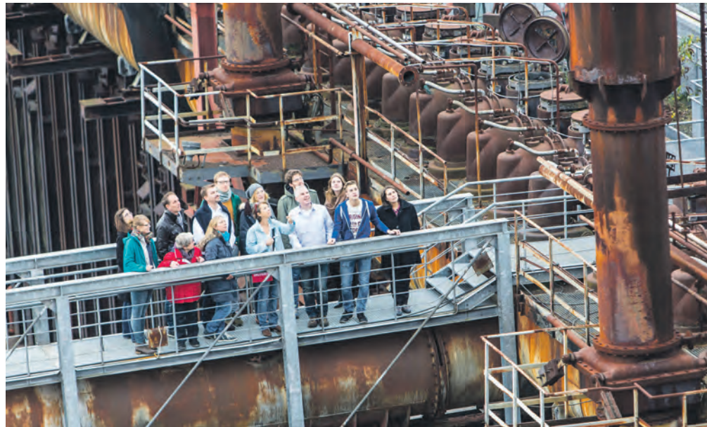
Das Führungsangebot auf Zollverein ist sehr vielfältig. Zur Auswahl stehen zahlreiche Möglichkeiten, das Welterbe – wie hier auf der Kokerei Zollverein – zu erkunden.

Kohlenwäsche mit Ausblick: Besucherinnen und Besucher folgen dem Weg der Kohle durch das größte Gebäude der Zeche. Wer sich der Führung „Von Kohle, Koks und harter Arbeit“ anschließt, erhält einen eindrucksvollen Einblick in die Produktionsabläufe der Kokerei.