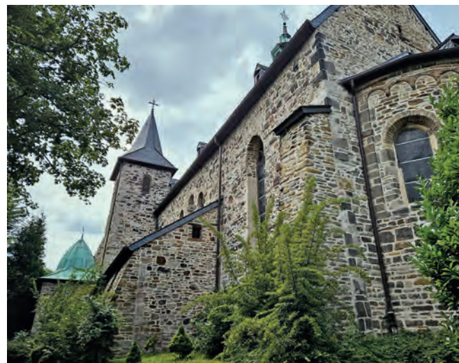
950 Jahre Stoppenberg – große Feier mit Gauklern, Ausstellung und Pontifikalamt.

Auch Schulklassen haben am Montag und Dienstag nach der Veranstaltung die Möglichkeit für eine Führung durch die Ausstellung, Ansprechpartner beim Geschichtskreis: Jürgen Nolte, nolte.kvs@gmx.de, Tel. 0201 325532. FBR