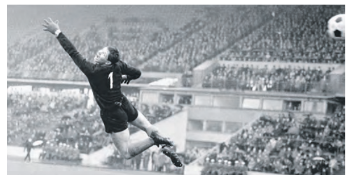
Der Torwart ist besiegt.

Stiftung Zollverein. Das hohe Publikumsinteresse haben die beiden Museen zum Anlass genommen, die gemeinsame Ausstellung auf dem UNESCO-Welterbe Zollverein bis Montag, 20. Mai 2024, zu verlängern. Insgesamt 450 Bilder zeigen eindrucksvoll das Gestrern und Heute aus 100 Jahren Ruhrgebietsfußball. Ergänzt werden die Fotografien um besondere Objekte wie das Original-Trikot von Helmut Rahn, das er zur WM 1954 getragen hat.