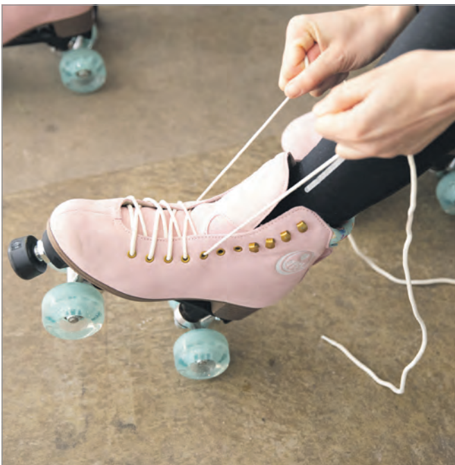
Die Vorfreude steigt: Während der Osterferien werden auf Zollverein wieder die Rollschuhe geschnürt.

Während der zwei Wochen ist die Rollschuhbahn täglich ab 10 Uhr geöffnet – mit zwei Ausnahmen: Am ersten Tag, 23. März 2024, beginnt der Rollschuhspaß ab 14 Uhr und am Karfreitag, 29. März 2024, müssen die Türen ganztägig geschlossen bleiben. Die Anzahl der Leih-Rollschuhe ist begrenzt. Für die eigene Sicherheit empfehlen die Stiftung Zollverein und SkateJam Dortmund, einen Helm sowie Knie- und Ellenbogenschützer zu tragen. Die Halle wird nicht beheizt, Rollschuhfans werden gebeten, sich dem Wetter entsprechend anzuziehen. Alle Infos, Termine, Tickets und Preise unter zollverein.de/rollschuhbahn .