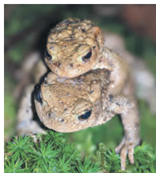
Verlassen ihre geschützten Winterquartiere: die Erdkröten (links) und Teichmolche (rechts).

chen auserkoren, klammert es sich schnell an ihrem Rücken fest. Auch andere tierische Bewohner, wie etwa Berg- und Teichmolche, suchen ihre Laichgewässer auf. Haben die Amphibien es zu den Teichen geschafft, können aufmerksame Besucherinnen und Besucher schnell Laichschnüre aus rund 2.000 bis 4.000 Eiern erspähen.