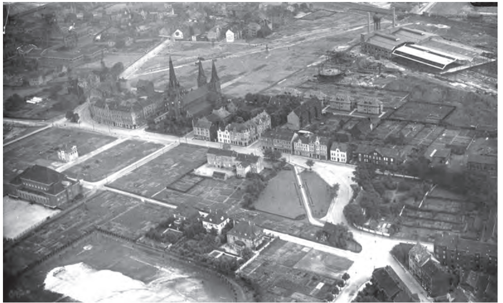
Das historische Bild von 1929 zeigt Rotthausen von oben kurz nach der Eingemeindung.