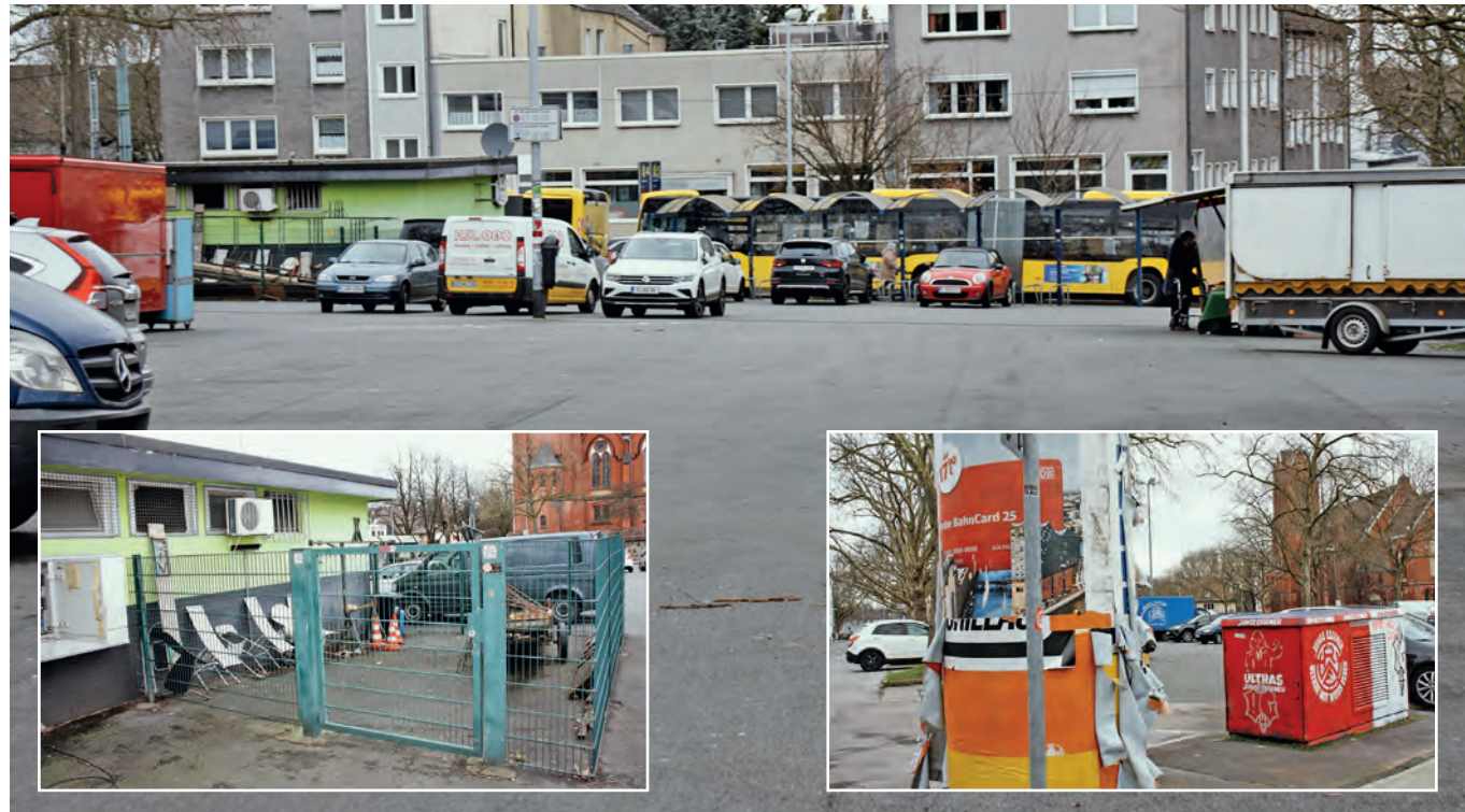
Impressionen vom Stoppenberger Markt: Ein echter Wohlfühl-Eindruck kommt da nicht auf.

Meinungssuche auf Wochenmarkt, bei Abendveranstaltung und bei Kindern und Jugendlichen