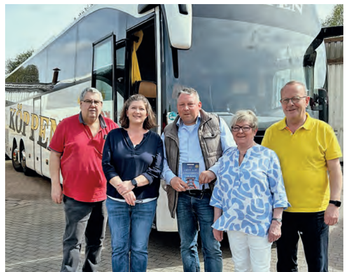
Auch der Katernberger Werbering gratulierte.