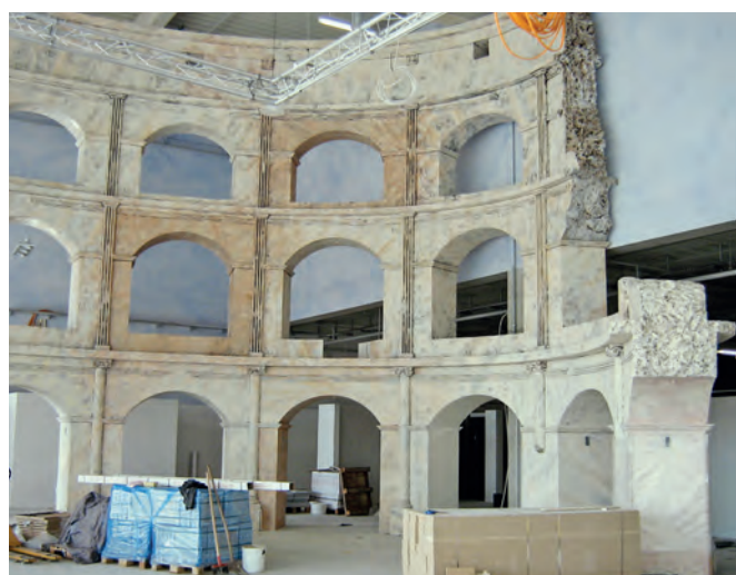
Kolosseum (28 m breit und 12,5 m hoch) für die Firma Vesta Küchen in Koblenz und Mannheim.

nehmen und war zunächst schwerpunktmäßig in den Bereichen Werbung, Dekoration und Beschriftung tätig - wobei auch eine regelmäßige, bis heute andauernde