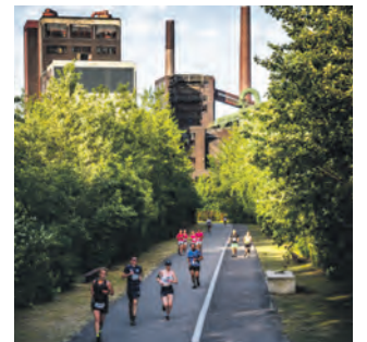
Zollverein wird zur Laufstrecke.

Einen einzigartigen Lauf inmitten wunderbarer Industriekulisse erleben und gleichzeitig Gutes tun – das ermöglicht der Herz-Kreislauf Essen, der alle Einnahmen sozialen Projekten zur Verfügung stellt. Zum zehnten Mal begeben sich Teilnehmerinnen und Teilnehmer einzeln oder in kleinen Gruppen auf die Strecke rund um den Doppelbock. Anmeldeschluss ist Montag, 29. April 2024. Vom 400 Meter Bambinilauf für Kinder bis hin zum Hauptlauf über 10 Kilometer: Kleine und große Lauffans können sich ihre Lieblingsstrecke aussuchen. Die Startgebühr beträgt 17,50 Euro pro Person, Kinder und Jugendliche unter 18 Jahren starten kostenfrei. Alle Infos unter herz-kreislauf-essen.de .