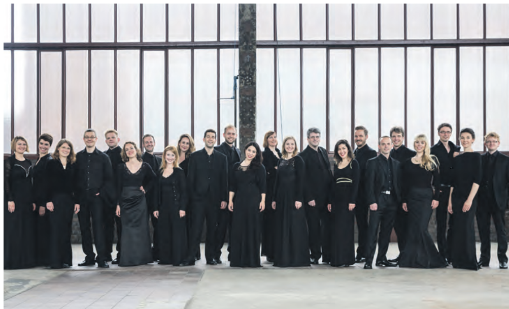
Stimmgewaltiger Besuch auf Zollverein: Das Vokalensemble CHORWERK RUHR verwandelt das Salzlager auf der Kokerei in einen Konzertsaal.

Als eines von drei Ensembles der Schlesischen Philharmonie in Kattowitz steht das Schlesische Kammerorchester auf der Zollverein-Büh-