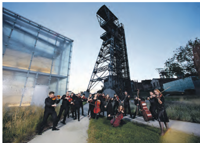
Ihr Europakonzert spielt die Schlesische Philharmonie auf der „schönsten Zeche der Welt“.

Aktuelle Informationen auf zollverein.de/konzerte .