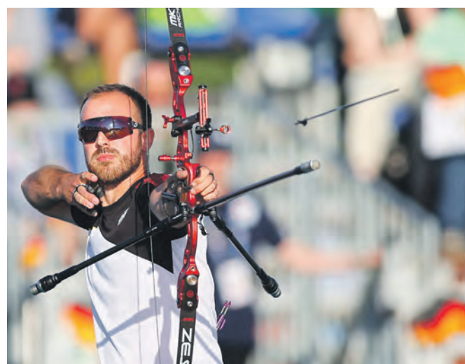
Wer sichert sich einen Platz auf dem Siegerpodest und wird Europameister 2024?

jeden Bogensportfan sicher ein unvergleichliches Erlebnis.“ Für Deutschland sieht er im Teamwettbewerb die härteste Konkurrenz in Italien, Frankreich, der Türkei, Spanien, Großbritannien und der Niederlande: „Die europäische Spitze ist im Augenblick hochklassig sehr breit gefächert.“ Auf der anderen Seite ist sich Bundestrainer Haidn sicher: „Wenn wir ‚unser Ding‘ machen, dann ist alles möglich.“ Das Wochenendticket gibt es ab 22 Euro, ein Tagesticket ab 12 Euro.