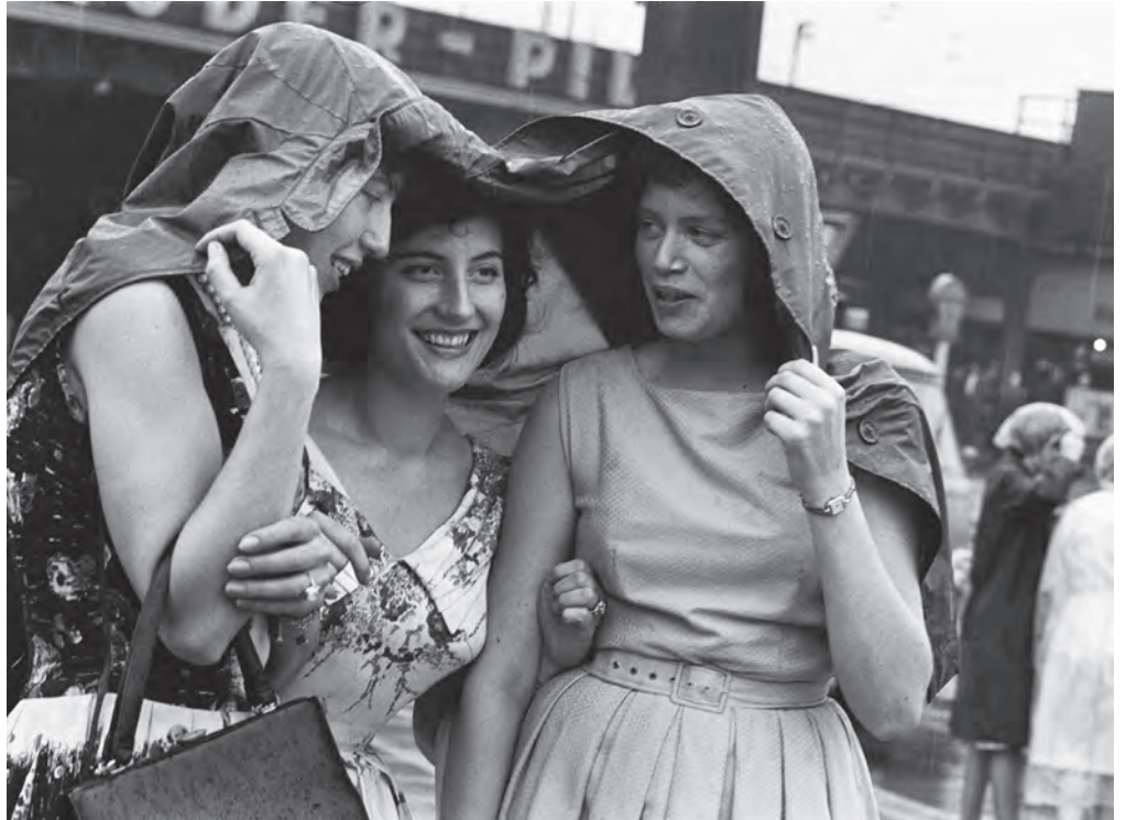
Verregener Sommer, Essen, August 1961.