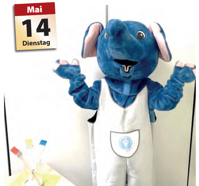
Monti, Maskottchen und Kinderbotschafter des Kinderschutzbundes Essen, gibt den Startschuss für das Kreativprojekt der Kitas.

Das Projekt schließt mit einer Ausstellungswoche. Während der drei „Bunten Wochen“ werden die kreativen Ergebnisse gesammelt und dokumentiert, fotografiert oder in Texten festgehalten. In der letzten Woche