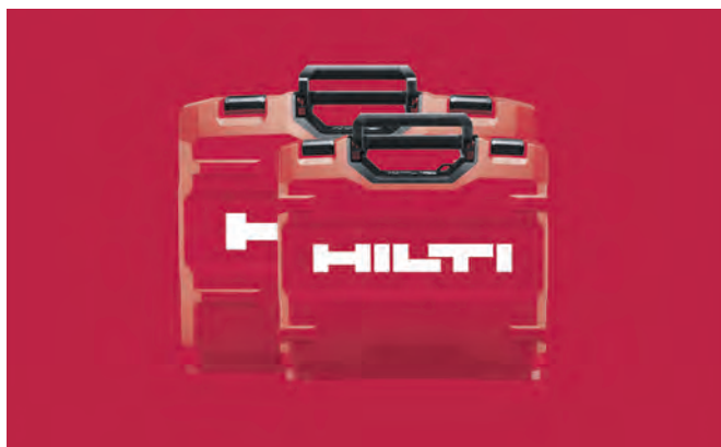
Das strahlende Rot der Marke Hilti auf dem Hilti Werkzeugkoffer – Design des Red Dot Gewinners 2018.

Wahrnehmung und Identität widerspiegeln. Während zu Beginn des letzten Jahrhunderts Primärfarben wie Blau, Rot und Gelb dominierten, blüht in der aktuellen Zeit ein Revival von Pastellfarben auf, die an die 1950er-Jahre erinnern. Diese Farben stehen für die Suche nach Orientierung und Identität in einer sich ständig verändernden Welt. Die Ausstellung zeigt, wie sich diese Entwicklung in den Farbtrends verschiedenster Produkte offenbart, angefangen bei Lautsprechern und Kopfhörern bis hin zu Kameras und Bürostühlen. Farben prägen nicht nur bekannte Marken, sondern geben auch Auskunft über Lebensstil und Kultur. Tickets gibt es ab 9 Euro, freitags gilt das Motto „Pay-What-You-Want“.