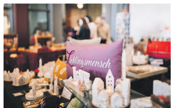
Von Postkarte bis Kissen: Beim „Handverlesen“-Designermarkt ist für jeden Geschmack etwas dabei.