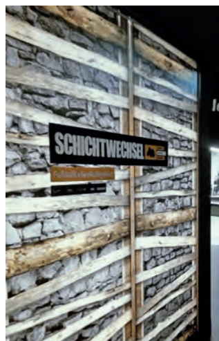
„Schichtwechsel“ im Deutschen Fußballmuseum in Dortmund.

nehmen und war zunächst schwerpunktmäßig in den Bereichen Werbung, Dekoration und Beschriftung tätig - wobei auch eine regelmäßige, bis heute andauernde