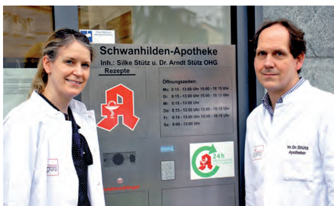
Auch eine automatische Abholung von Medikamenten rund um die Uhr hat das Geschwisterpaar Stütz im Angebot.

So läuft es jetzt in den beiden Apotheken am Markt richtig rund, wofür sich auch das sympathische Geschwisterpaar mit allen Kräften und viel Zeitaufwand einsetzt. Und im Rahmen eines Eröffnungsfestes wird das auch mit den Kunden, Mitarbeitern und Anwohnern im Sommer gefeiert; aufgrund der jetzt momentan bestehenden Coronasituation wird das in der wärmeren Jahreszeit nachgeholt.