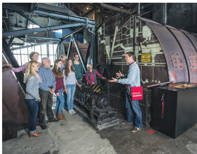
Auf dem Weg der Kohle „öffnen“ sich die riesigen Anlagen durch Multimedialechnik.

sucherinnen und Besucher entdecken auf der Gegenwartsebene die Mythen, Bilder und Phänomene einer der größten Industrieregionen der Welt und steigen – dem Weg der Kohle weiter folgend – immer weiter in die Geschichte der Region hinab. In den Bunkern der Gedächtnisebene lernen sie kostbare Kulturschätze aus der vorindustriellen Zeit kennen. Die Geschichte der Industrialisierung wartet auf der letzten Ebene und führt sie durch 200 Jahre Kohlenpott zurück in die heutige Metropole Ruhr. Alle Infos zu den Führungsangeboten auf dem Welterbe gibt's online auf zollverein.de/fuehrungen