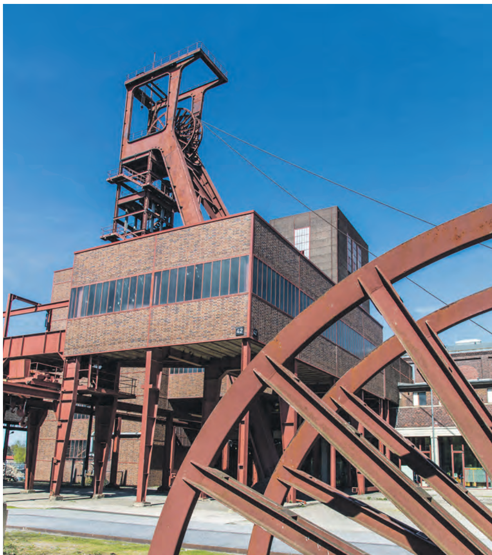
Das Fördergerüst über Schacht 1 entstand zwischen 1956 und 1958. Der gemauerte Förderturm dahinter ist heute noch in Betrieb und dient der Wasserhaltung.

Die Schachtanlage 1/2/8 hat in der langen Zeit ihres Bestehens ihr Gesicht mehrfach verändert. Von der ursprünglichen Anlage ist