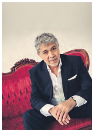
Monty Alexander, der Jazzler aus Jamaika.

Aktuelle Informationen auf www.zollverein.de/konzerte . Tickets für das Klavierfestival Ruhr gibt es auf tickets.klavierfestival.de , für alle weiteren Konzerte unter 0180/6050400 (kostenpflichtig), auf www.adticket.de , an allen Vorverkaufsstellen und im Besucherzentrum Ruhr.