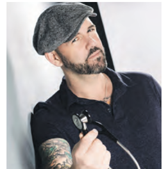
TV-Mediziner Doc Esser.

platz vor der Tür und im Kopf“. Seit 2012 ist die 1989 geborene Da Vina auf den deutschsprachigen Poetry-Slam- und Kabarett-Bühnen unterwegs. Fehlt nur noch das Catering zum Ruhrgebiets-Frühschoppen, und das ist selbstverständlich regional: Wirt Siggie Brandenburg und