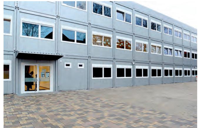
Die Grundschulkinder finden eine schulische „Übergangsheimat“ in Pavillons an der Immelmannstraße.

den Pausen. Beide Schulen erhalten jeweils ein neues Schulgebäude, nach Abriss des alten Gebäudes werden diese aber nicht vor dem Jahr 2028 bezugsfertig sein. „Ich freue mich, dass die Schülerinnen und Schüler seit Jahresbeginn in den neuen Schulpavillons unterrichtet werden können – ganz besonders, weil jetzt wieder geradeaus gelernt werden kann. Der Schiefstand des alten Gebäudes hat immer wieder gesundheitliche Probleme zu Tage gefördert und einen normalen Schulalltag schwierig gestaltet. Ab jetzt steht wieder das Lernen im Mittelpunkt. Ein besonderer Dank geht