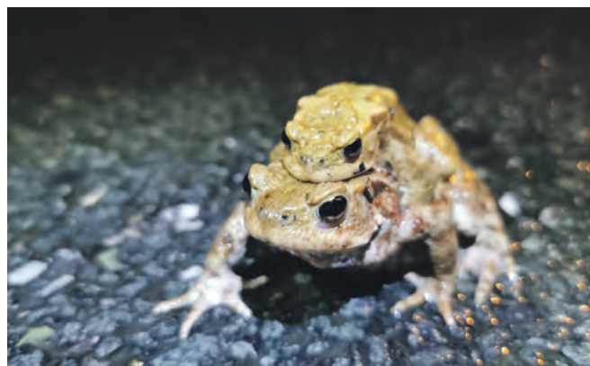
Huckepack geht es vom geschützten Rückzugsort der Kröten zu den Laichgewässern auf Zollverein.

Auffangbehältern“, erzählt Sarah Bölke vom NABU Ruhr. „Ganz vereinzelt sind auch schon Kreuzkröten dabei.“ Die streng geschützte Krötenart, die ebenfalls auf dem Zechengelände zu Hause ist, laicht normalerweise erst später im Jahr.