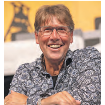
ARD-Moderator Peter Großmann.

sein Team versorgen Gäste und Publikum mit Heiß- und Kaltgetränken und belegten Brötchen. #halbzwölf in Halle 12: Sonntag, 27. März 2022, 11.30 Uhr. Eintritt: 15 €, ermäßigt 9 €. Tickets unter 0180/6050400 (kostenpflichtig), online auf www.reservix.de und an allen Vorverkaufsstellen.