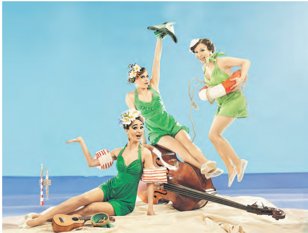
Die Zucchini Sistaz erwecken die goldene Swing-Ära zum Leben und kokettieren dabei mit allerlei Zitaten aus der gesamten Pop-Geschichte.