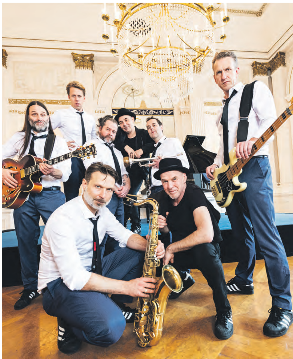
Seit fast 30 Jahren wirbeln sie nicht nur durch den Jazz, sondern durch die deutsche Rap-Szene: Die Jazzkantine tritt beim „Jazz in the City“-Festival auf.

Zum fünften Mal ist „Alexander the Great“ beim Klavierfestival zu Gast. Seit Jahrzehnten international als begnadeter Techniker und Virtuose mit unvergleichlicher Spielfreude gefeiert, besinnt sich der Jazzler aus Jamaika immer wieder auf seine Wurzeln – so spielt er auch auf Zollverein swingenden Triojazz mit karibischen Einflüssen. 12. Juni 2022, 20 Uhr, Halle 5 (ab 25 Euro)