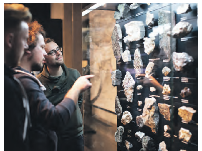
Das Ruhr Museum präsentiert auf drei Etagen die Natur- und Kulturgeschichte der Region.