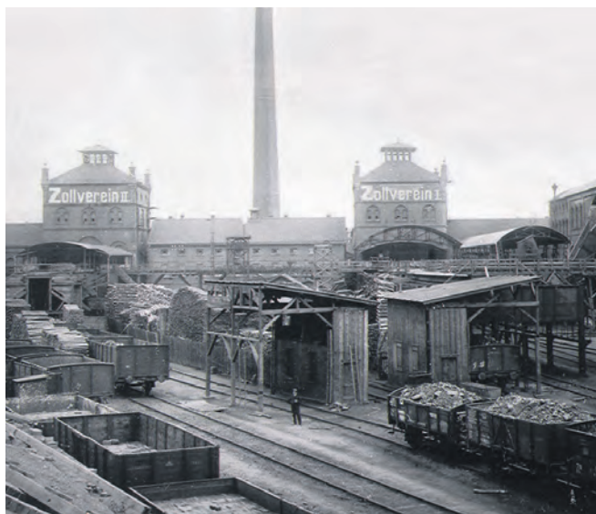
Über den Schächten 1 und 2 thronten einst beeindruckende Malakow-Türme.