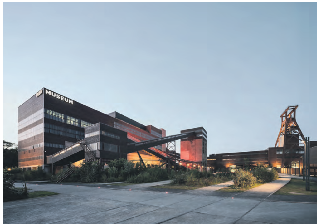
Die Kohlenwäsche ist das größte Gebäude auf Schacht XII. Zu Betriebszeiten der Zeche liefen hier täglich bis zu 23.000 Tonnen Kohle hindurch.

Die Kohlenwäsche war zu Betriebszeiten eine Riesmaschine: Bis zu 23.000 Tonnen Rohkohle durch-