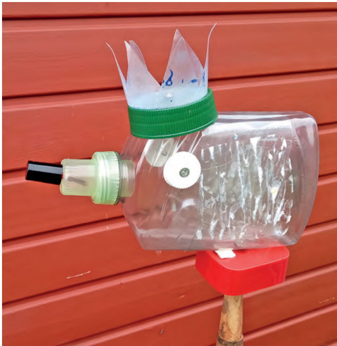
Auch spezielle Angebote für junge Menschen sind in diesem Semester wieder dabei.

Öffnungszeiten: Do., Sa. und So. 14 – 16 Uhr (und nach Vereinbarung)