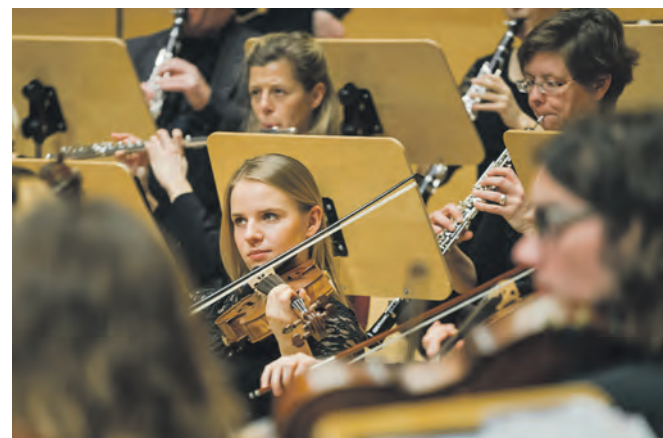
Das Universitätsorchester Duisburg-Essen ist mit Fauré, Beethoven und Brahms zurück auf Zollverein.