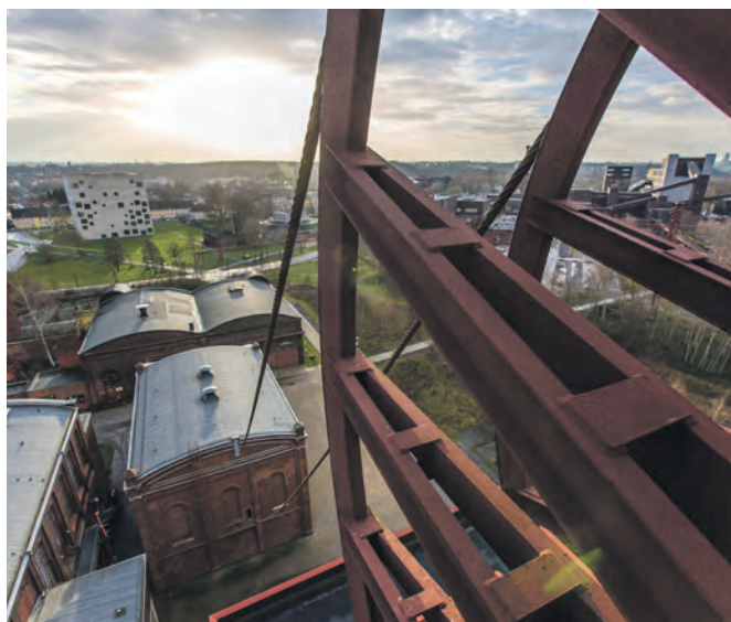
Der Sonnenaufgang vom Fördergerüst auf Schacht 1/2/8 aus betrachtet, unten PACT und der Kunstschacht.

nach der Stilllegung eine neue Nutzung. Die meisten Gebäude blieben erhalten: In der alten Waschkauke residiert heute PACT Zollverein, im Wagenumlauf befindet sich die Mitmachzeche, und das zentrale Maschinenhaus ist heute der Kunstschacht von Thomas Rother. Lediglich von Schacht 8 ist nicht mehr viel zu sehen. Doch zwischen dem Parkplatz und der alten Waschkauke kann man an seiner Stelle heute noch ein Rohr erkennen, das aus dem Boden kommt und sich nach einigen Wendungen zu einem roten Kopf, einer sogenannten „Protegehauke“, hinschlingt. Hiermit soll das Grubengas Methan, das sich durch den längst verfüllten alten Schacht an die Erdoberfläche durcharbeiten könnte, gesammelt und sicher abgeleitet werden.